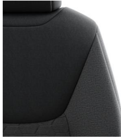
Sitzbezug Stoff, schwarz mit Ziernähten in Melange