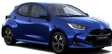
8Y8 Juniper Blue Metallic