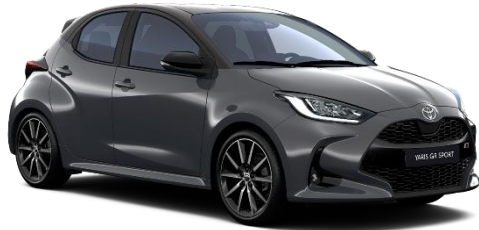
M29 Storm Grey / Onyx Black