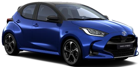
M20 Juniper Blue / Onyx Black