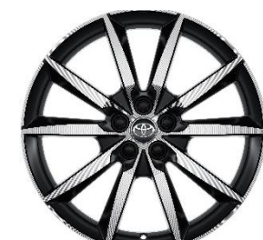
18" Leichtmetallfelge 5 Doppelspeichen schwarz/oberflächenpoliert