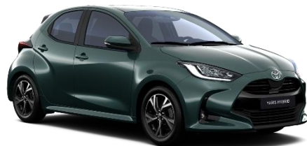
6X7 Everest Green Metallic