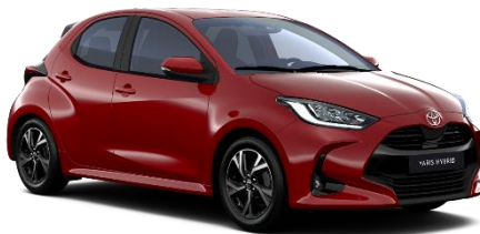
3U5 Emotional Red Metallic

Erfahrungsgemäß können Druckfarben den Farbton von Lackierungen nicht originalgetreu wiedergeben