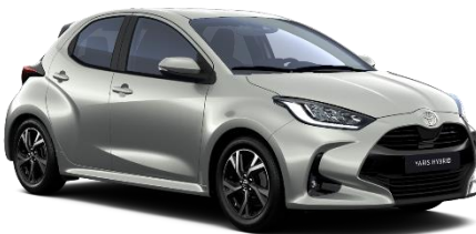
1L0 Shimmering Silver Metallic