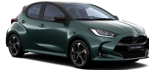
M39 Everest Green / Onyx Black