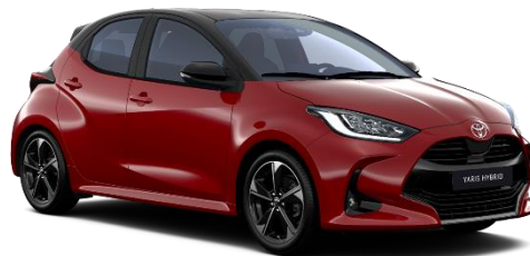
2SZ Emotional Red / Night Sky Black

Erfahrungsgemäß können Druckfarben den Farbton von Lackierungen nicht originalgetreu wiedergeben