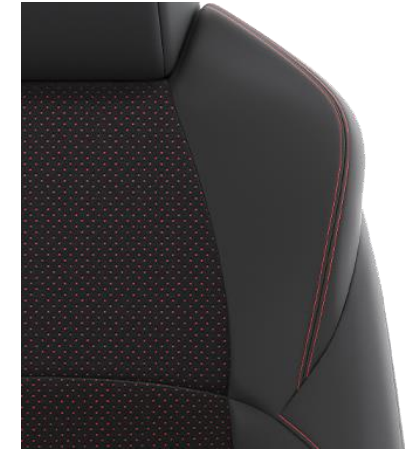
Sitzbezug Ultrasuede™/Textillieder Schwarz mit Ziernähten in Rot