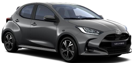
1G3 Ash Grey Metallic