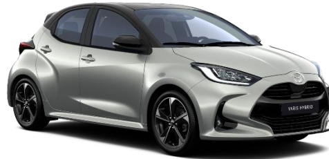
2VU Shimmering Silver / Onyx Black