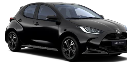
209 Night Sky Black Metallic