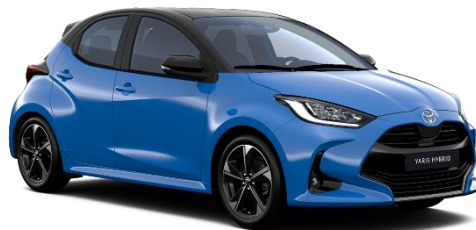
M19 Neptune Blue / Onyx Black