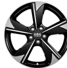
17" Leichtmetallfelge 5 Doppelspeichen schwarz