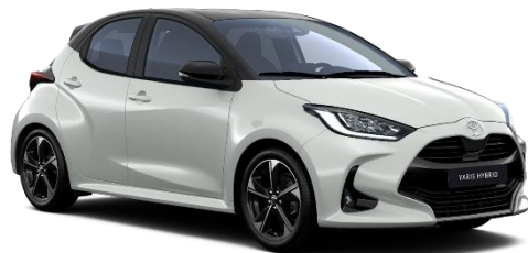
2PU Platinum Pearlwhite / Night Sky Black