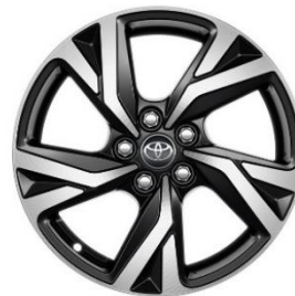
16" Leichtmetallfelge 5 Doppelspeichen schwarz/silber