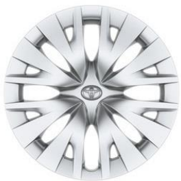
15" Stahlfelge Radzierkappe silber