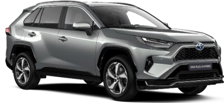
1D6 Zircon Silver Metallic