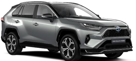
2QY Zircon Silver/Black Metallic