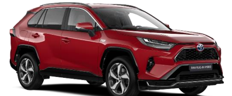
3U5 Emotional Red Metallic