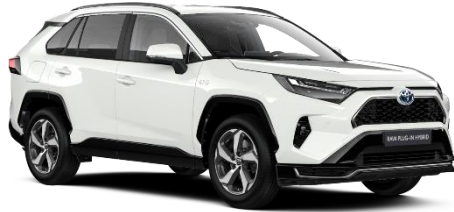
040 Pure White