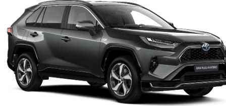
1G3 Ash Grey Metallic