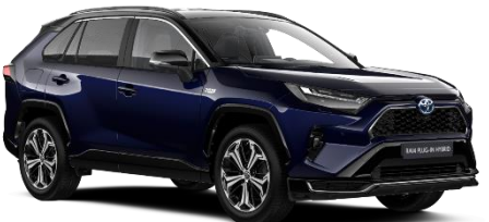
2RA Midnight Blue/Black Metallic