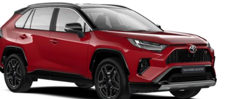
2PS Emotional Red/Black Metallic

Erfahrungsgemäß können Druckfarben den Farbton von Lackierungen nicht originalgetreu wiedergeben