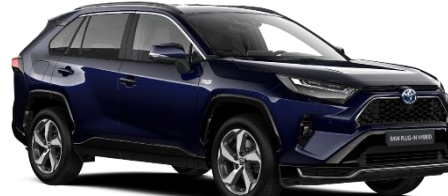
8X8 Midnight Blue Metallic