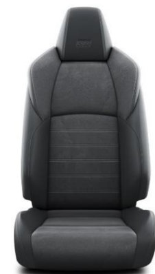
GR SPORT Paket

Sitzbezug Ultrasuede™ / Textilleder Schwarz mit Ziernähten in Silber