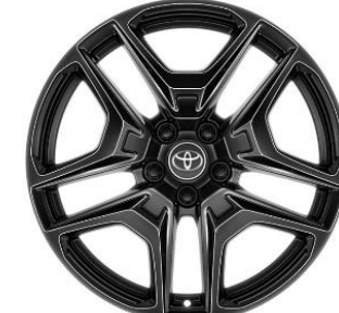
GR SPORT Paket

19" Leichtmetallfelgen 5 Doppelspeichen Schwarz/weißer Deko Line