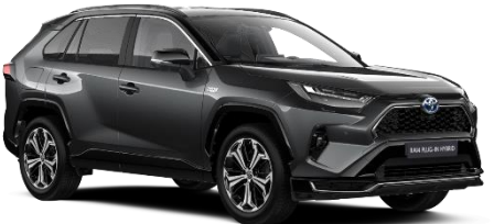
2QZ Ash Grey/Black Metallic