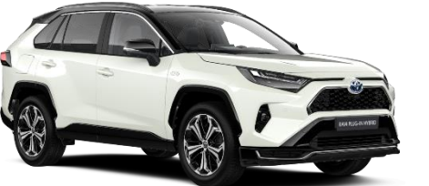
2PS Platinum Pearlwhite/Black Metallic