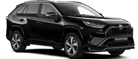
218 Attitude Black Metallic