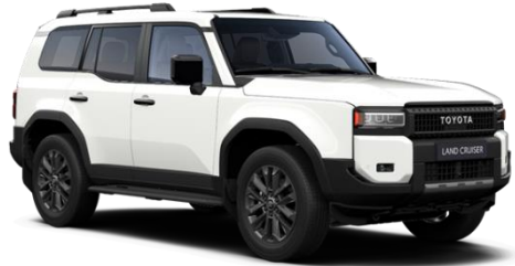
040 Pure White