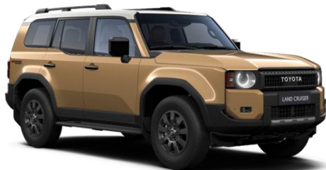
2ZC Sand Metallic / Light Grey