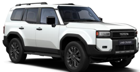
089 Platinum Pearlwhite Metallic

Erfahrungsgemäß können Druckfarben den Farbton von Lackierungen nicht originalgetreu wiedergeben