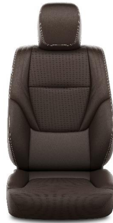
Sitzbezug Leder kastanienbraun (40)