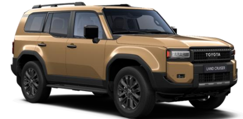
5C8 Sand Metallic