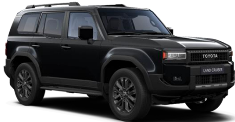
218 Attitude Black Metallic