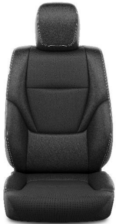
Sitzbezug veganes Leder schwarz (20)