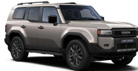
4V8 Avantgarde Bronze Metallic