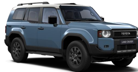
2ZD Smoky Blue Metallic / Light Grey