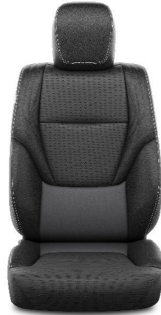
Sitzbezug Leder schwarz (20)