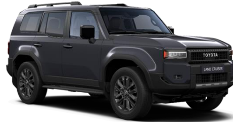
1L7 Dark Grey