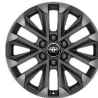
20" Leichtmetallfelgen 6 Doppelspeichen mattgrau