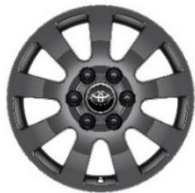
18" Leichtmetallfelgen 9 Speichen mattgrau