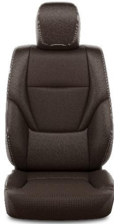
Sitzbezug veganes Leder kastanienbraun (40)