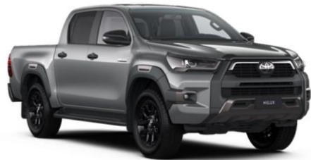
1D6 Zircon Silver Metallic