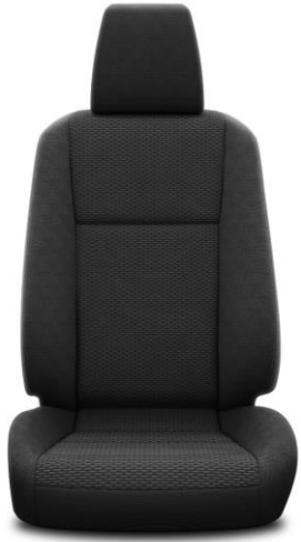
Sitzbezug Stoff schwarz