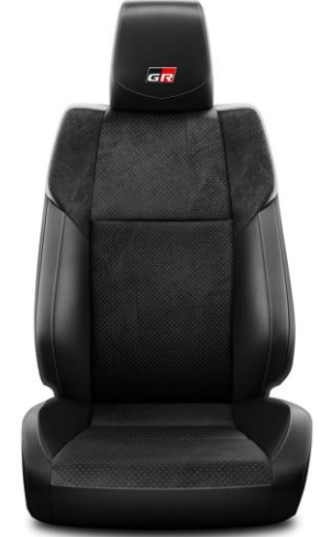
Sitzbezug Suede® perforiert 2) mit Leder-Applikation und silber Ziernähten schwarz