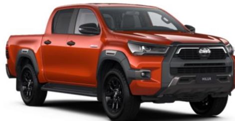
4R8 Inferno Orange Metallic