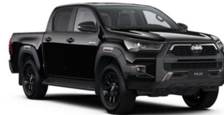
218 Attitude Black Metallic