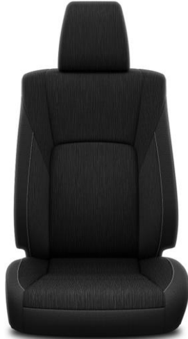
Sitzbezug Stoff schwarz