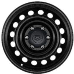
17" Stahlfelge mit Nabenkappe schwarz