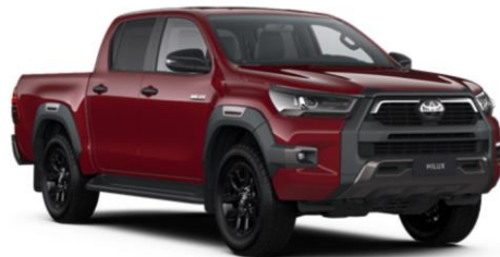
3T6 Crimson Spark Red Metallic