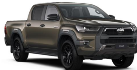
6X1 Oxide Bronze Metallic