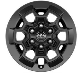
17" Leichtmetallfelgen 6 Doppelspeichen schwarz