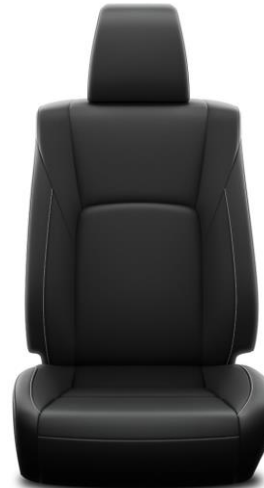
Sitzbezug Leder schwarz