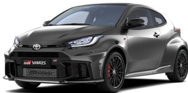
1L5 Precious Metal