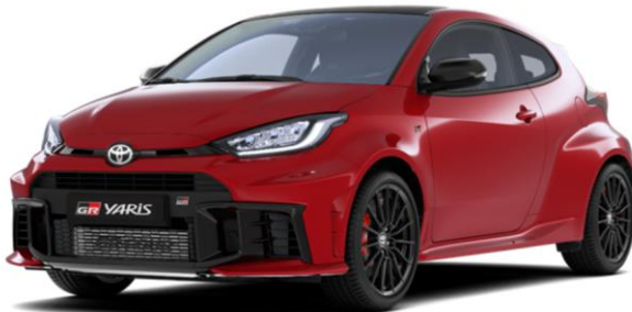
3U5 Emotional Red