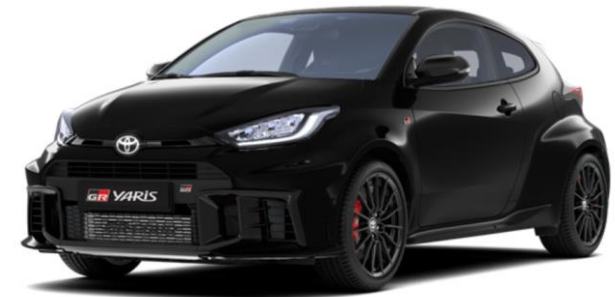
219 Precious Black