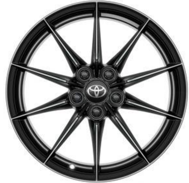
18" Leichtmetallfelge, geschmiedet 10 Speichen schwarz