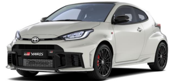
089 Platinum Pearlwhite

Erfahrungsgemäß können Druckfarben den Farbton von Lackierungen nicht originalgetreu wiedergeben. Die Preise sind unverbindliche Preisempfehlungen des Herstellers ab Werk in Euro exkl. NOVA und MwSt.