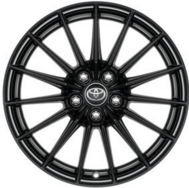
18" Leichtmetallfelge 15 Speichen schwarz