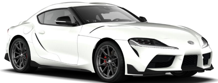
D01 Subzero White