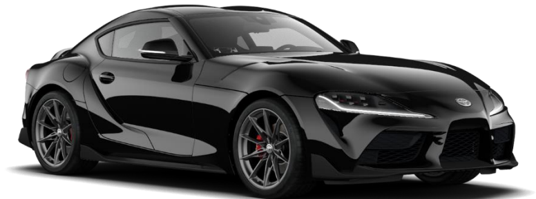
D04 Midnight Black