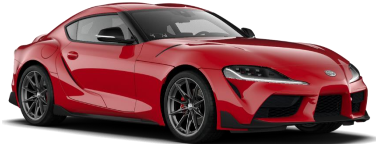
D05 Prominence Red