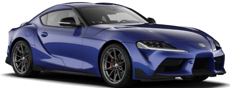
D13 Dawn Blue