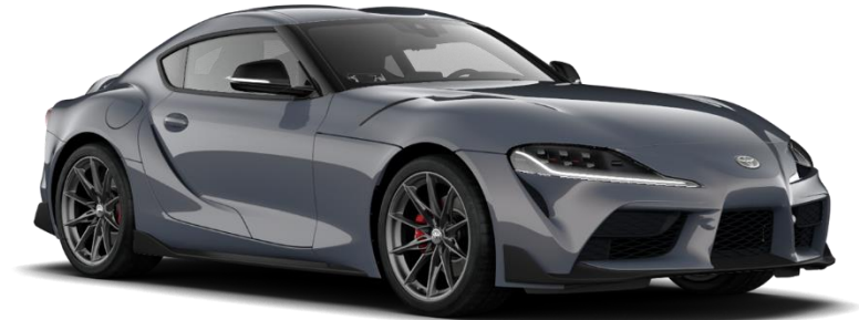
D14 Moeraki Grey

Erfahrungsgemäß können Druckfarben den Farbton von Lackierungen nicht originalgetreu wiedergeben.