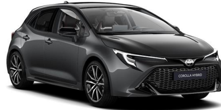
2MB Ash Grey / Night Sky Black