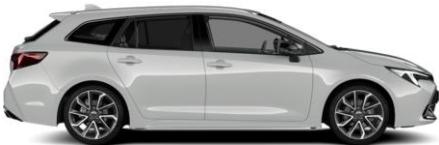
1K6 Dynamic Grey Metallic