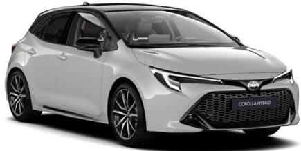
2RZ Dynamic Grey / Night Sky Black