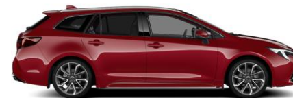
3U5 Emotional Red Metallic