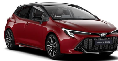
2SZ Emotional Red / Night Sky Black