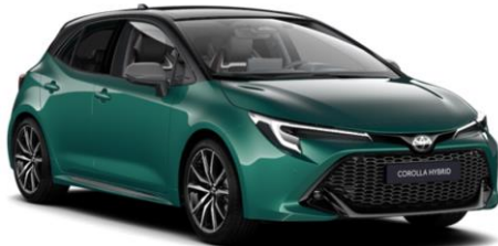
M28 Super Green / Night Sky Black