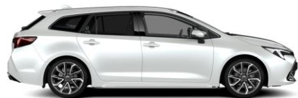
089 Platinum Pearlwhite Metallic