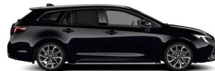
209 Night Sky Black Metallic