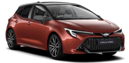
M42 Metal Oxide / Night Sky Black