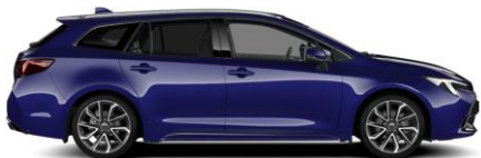
8Y8 Juniper Blue Metallic