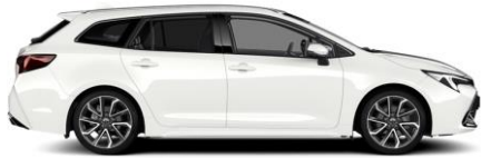
040 Pure White