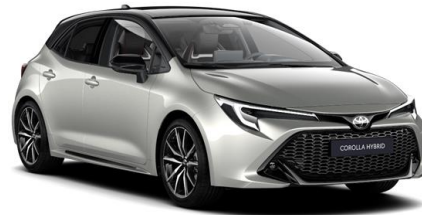
2RD Precious Silver / Night Sky Black