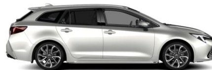
1J6 Precious Silver Metallic