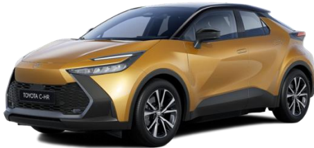
2YT – Sulfur Gold / Onyx Black