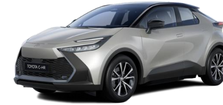
2MR – Sonic Silver / OnyxBlack