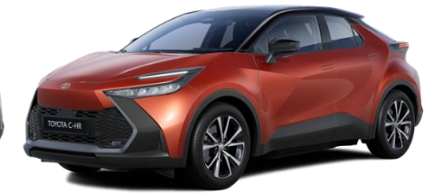
M35 – Metal Oxide / Onyx Black

Erfahrungsgemäß können Druckfarben den Farbton von Lackierungen nicht originalgetreu wiedergeben.