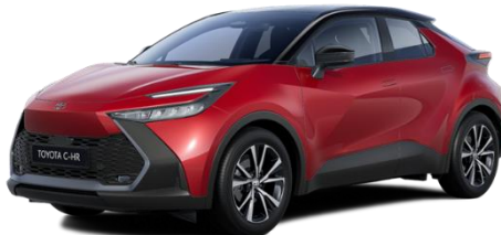
3U5/2TB – Emotional Red / Onyx