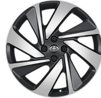
18" Leichtmetallfelge 4 Doppelspeichen, schwarz/oberflächenpoliert