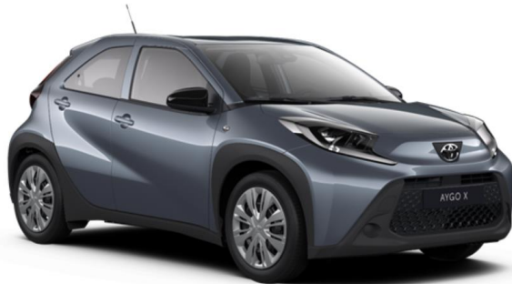
1K3 Persian Salt Metallic