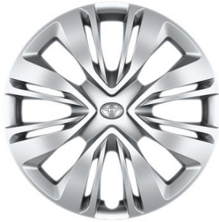
17" Stahlfelge Radzierkappe Silber