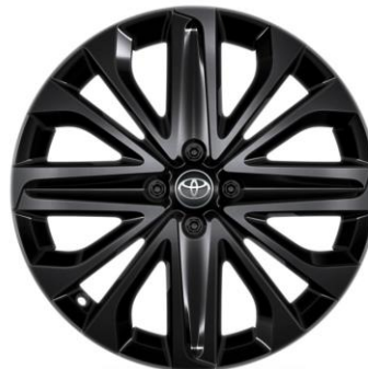
18" Leichtmetallfelge 4 Doppelspeichen, Glossy Black