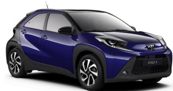
2VL Juniper Blue Metallic / Night Sky Black