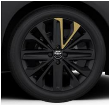
18" Leichtmetallfelge 4 Doppelspeichen, matt schwarz mit Ginger Beige-Akzenten