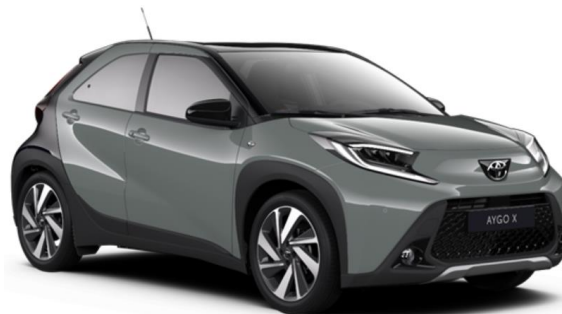
2VN Tarragon (Premium Pastel) / Night Sky Black

Erfahrungsgemäß können Druckfarben den Farbton von Lackierungen nicht originalgetreu wiedergeben