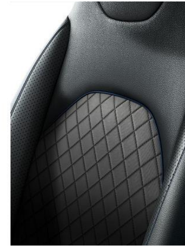
AYGO X EXPLORE

Sitzbezug (LC30, LC40, LC10, LC80, LC61) Sitzmittelbahnen: Stoff, schwarz mit Nähten in Wagenfarbe Seitenwangen: Teilleder