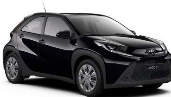
209 Night Sky Black Metallic