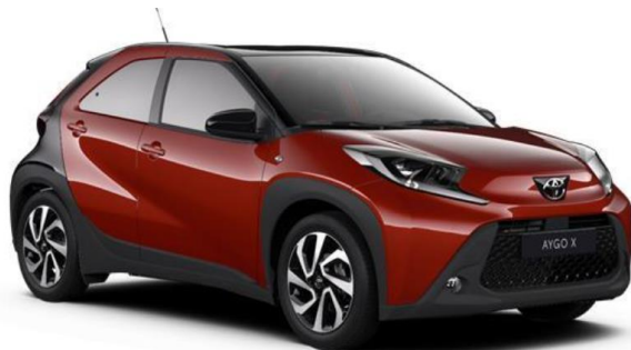
2VH Chili Red (Pearl) / Night Sky Black