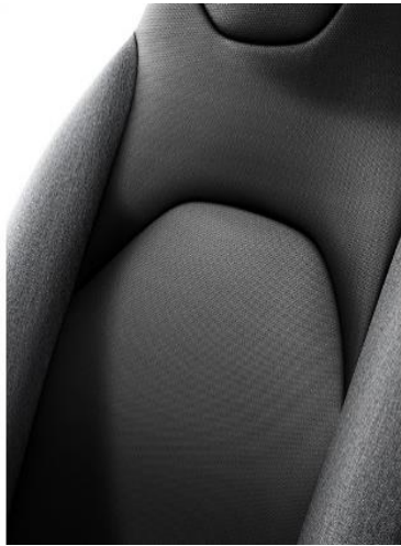
AYGO X PLAY

Sitzbezug (FA20) Sitzmittelbahnen: Stoff, schwarz Seitenwangen: Stoff, grau