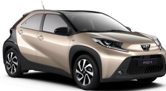
2VJ Ginger Beige Metallic / Night Sky Black