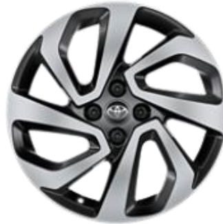
17" Leichtmetallfelge 4 Doppelspeichen, schwarz/oberflächenpoliert