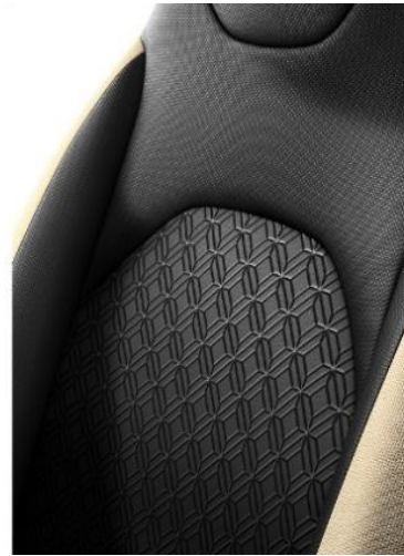
AYGO X PULSE/ AIR STYLE

Pulse: Sitzbezug (FB30/40/10/80, 61) Sitzmittelbahnen: Stoff, schwarz Seitenwangen: Stoff, in Wagenfarbe