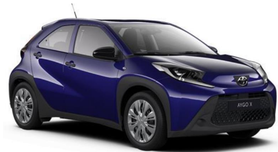
8Y8 Juniper Blue Metallic

Erfahrungsgemäß können Druckfarben den Farbton von Lackierungen nicht originalgetreu wiedergeben