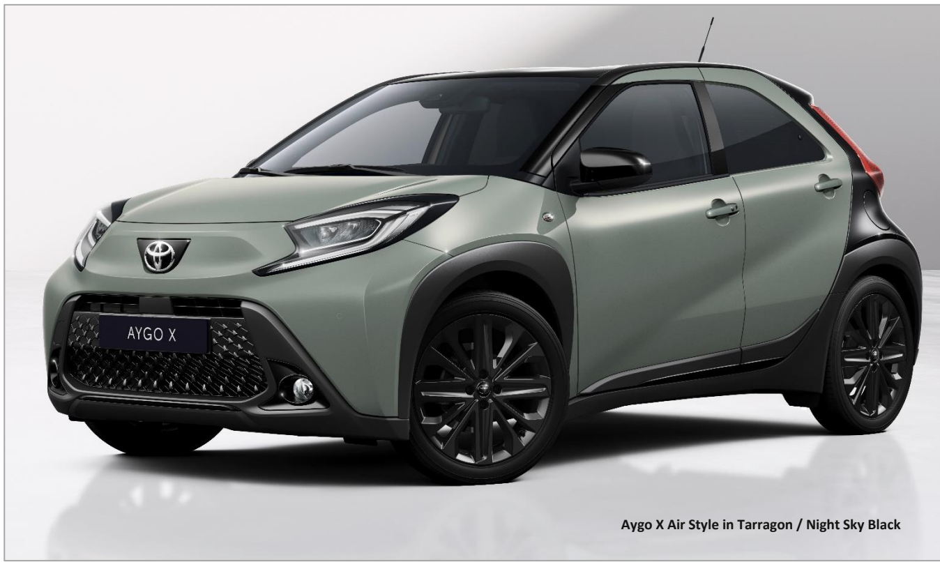
Aygo X Air Style in Tarragon / Night Sky Black