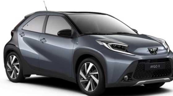
2UP Persian Salt Metallic / Night Sky Black