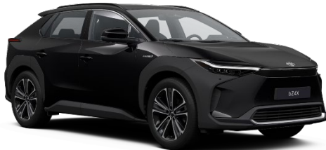
202 Onyx Black Metallic