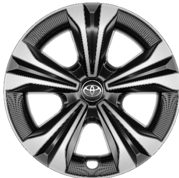
18" Leichtmetallfelgen inkl. Kunststoffabdeckung 5 Speichen schwarz / silber