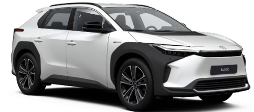
089 Platinum Pearlwhite Metallic