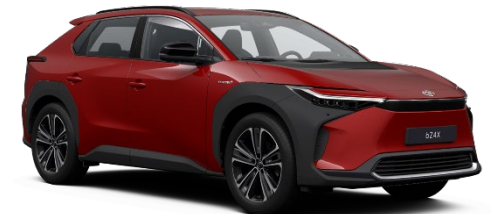
3U5 Emotional Red Metallic