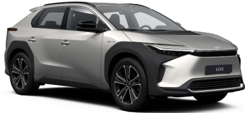
1J6 Sonic Silver Metallic