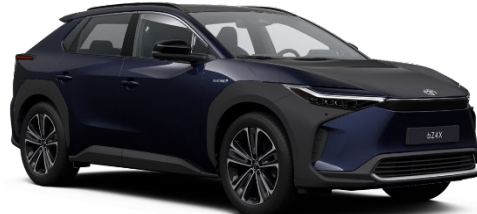
8S6 Pacific Blue Metallic