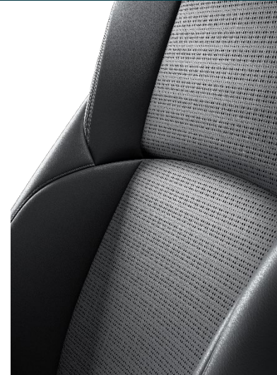
Textilleder, perforiert schwarz | hellgrau