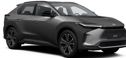
1L5 Precious Metal Metallic