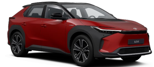
2TB Emotional Red/Black Metallic