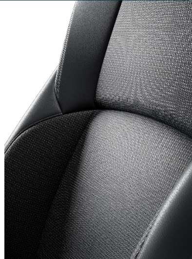
Stoff mit Textilleder-Applikationen schwarz