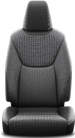
Sitzbezug Stoff schwarz