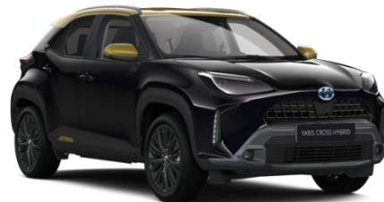
2UB Night Sky Black Metallic / Gold

Erfahrungsgemäß können Druckfarben den Farbton von Lackierungen nicht originalgetreu wiedergeben