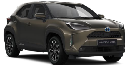
6X1 Oxide Bronze Metallic