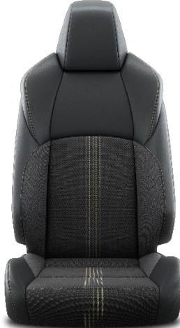
Sitzbezug Stoff mit Textilleder- Applikationen 1 schwarz