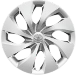
16" Stahlfelge mit Zierkappe silber