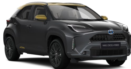
2UA Ash Grey Metallic / Brass Gold