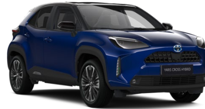
2VT Cobalt Blue Metallic / Black