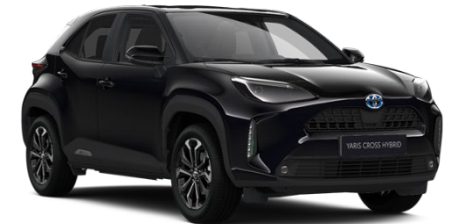
209 Night Sky Black Metallic