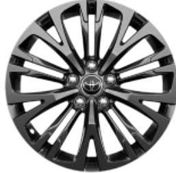
18" Leichtmetallfelge 5 Tripplespeichen anthrazit