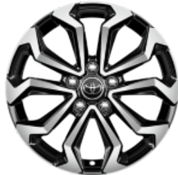
17" Leichtmetallfelge 5 Doppelspeichen schwarz/silber