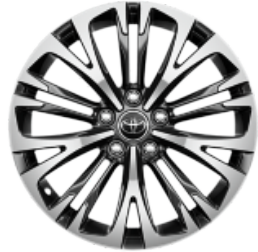
18" Leichtmetallfelge 5 Tripplespeichen schwarz/silber