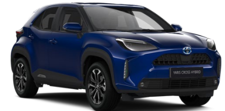
8W7 Cobalt Blue Metallic