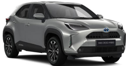
1L0 Shimmering Silver