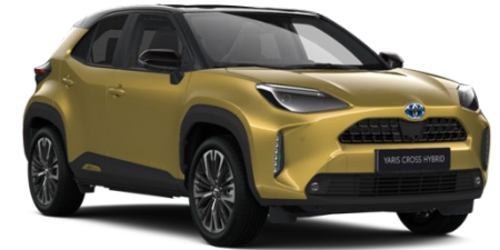
2VS Brass Gold Metallic / Black