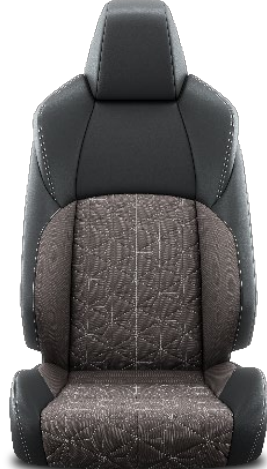
Sitzbezug Stoff mit Textilleder- Applikationen 1 taupe