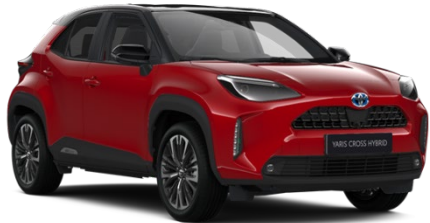
2SZ Emotional Red Metallic / Black