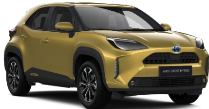
5C2 Brass Gold Metallic