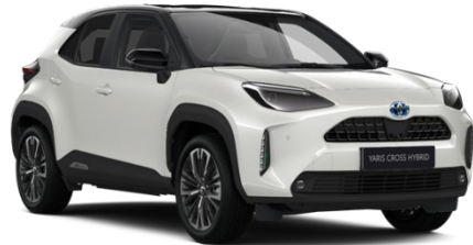
2PU Platinum Pearlwhite Metallic / Black