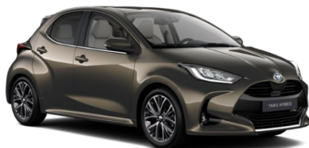
6X1 Oxide Bronze Metallic