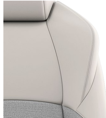
Sitzbezug Stoff mit Textillieder- Applikationen, grau