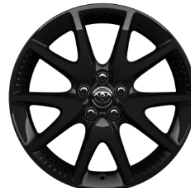
17" Leichtmetallfelge 5 Doppelspeichen schwarz