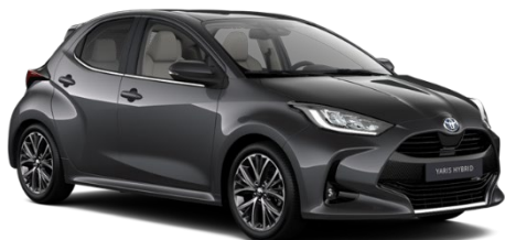
1G3 Ash Grey Metallic