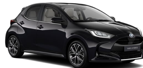
209 Night Sky Black Metallic