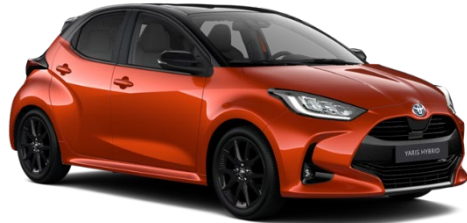
2KV Inferno Orange / Night Sky Black