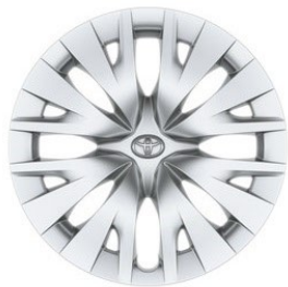
15" Stahlfelge Radzierkappe silber