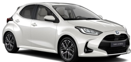
089 Platinum Pearlwhite Metallic