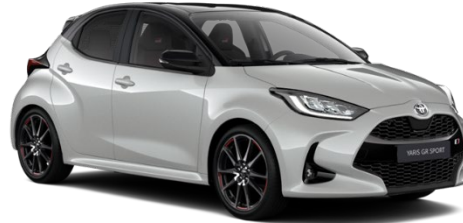
2RZ Dynamic Grey / Night Sky Black