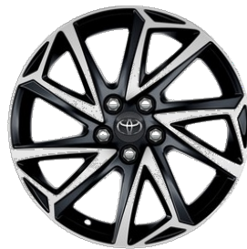
16" Leichtmetallfelge 5 Doppelspeichen schwarz/silber