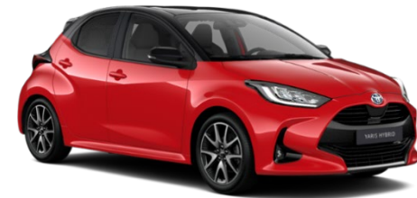
2SW Tokyo Fusion / Night Sky Black