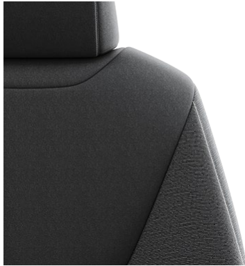
Sitzbezug Stoff schwarz