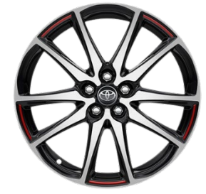
18" Leichtmetallfelge 5 Doppelspeichen schwarz/oberflächenpoliert