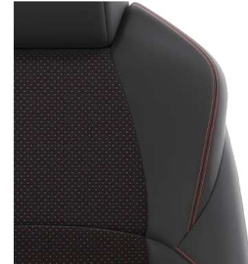
Sitzbezug Ultrasuede™/Textillieder Schwarz mit Ziernähten in Rot