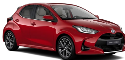
3U5 Emotional Red Metallic