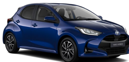
8W7 Cobalt Blue Metallic