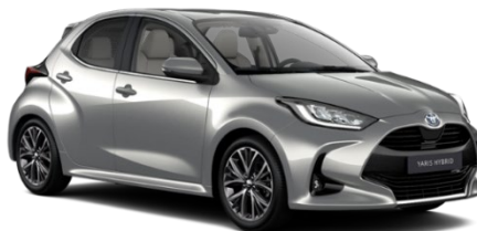
1L0 Shimmering Silver Metallic