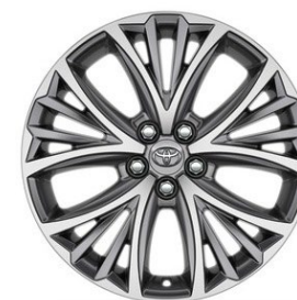
17" Leichtmetallfelge 5 Triple-Speichen schwarz/silber