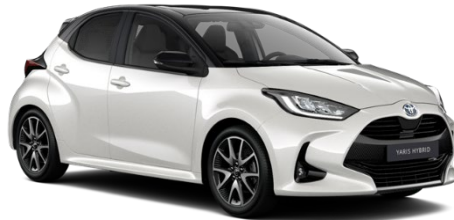
2PU Platinum Pearlwhite / Night Sky Black