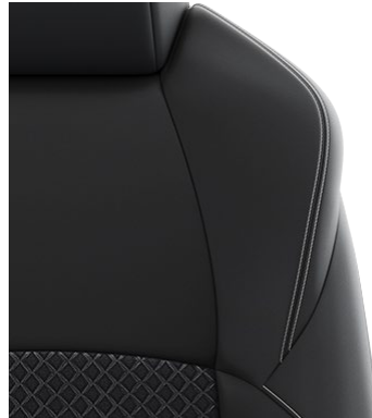
Sitzbezug Stoff mit Textillieder- Applikationen, schwarz mit Ziernähten in Grau