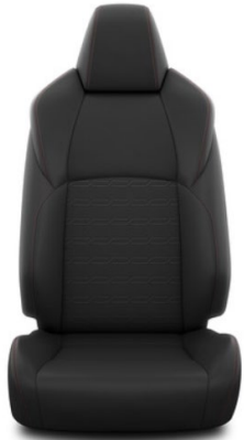
Sitzbezug Stoff schwarz Ziernähten in rot