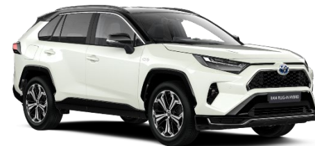
2QJ Pearl White/Black Metallic