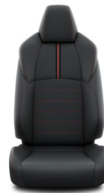
Sitzbezug Leder 1) schwarz Ziernähten und Highlights in rot