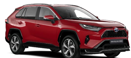
3U5 Emotional Red Metallic