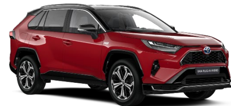
2SC Emotional Red/Black Metallic