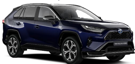
2RA Midnight Blue/Black Metallic