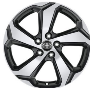
18" Leichtmetallfelgen 5 Speichen silber / anthrazit