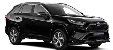
218 Attitude Black Metallic