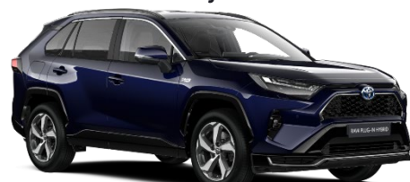
8X8 Midnight Blue Metallic