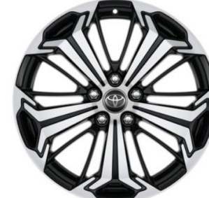
19" Leichtmetallfelgen 5 Triple-Speichen silber / schwarz