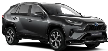
2QZ Ash Grey/Black Metallic