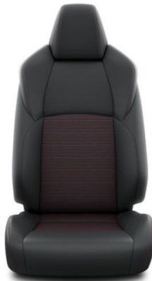
Sitzbezug Teilleder schwarz Ziernähten in rot