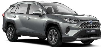
1D6 Zircon Silver Metallic