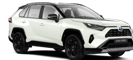
2PS Platinum Pearlwhite Metallic/Black

Erfahrungsgemäß können Druckfarben den Farbton von Lackierungen nicht originalgetreu wiedergeben