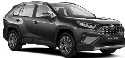
1G3 Ash Grey Metallic