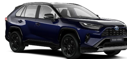
2RA Midnight Blue Metallic/Black