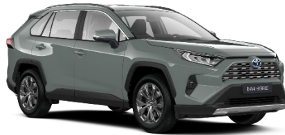
6X3 Urban Khaki