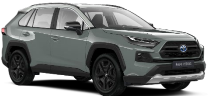
2QU Urban Khaki / Dynamic Grey