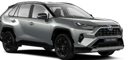
2QY Zircon Silver Metallic/Black