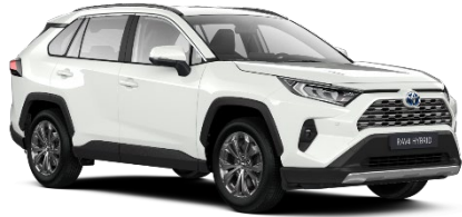
040 Pure White