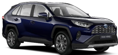
8X8 Midnight Blue Metallic