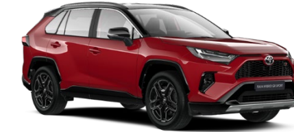
2SU Emotional Red / Black