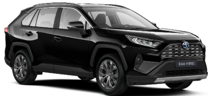
218 Attitude Black Metallic