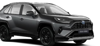
2QZ Ash Grey Metallic/Black