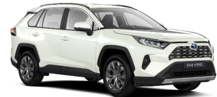
089 Platinum Pearlwhite Metallic