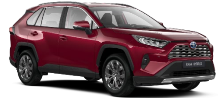
3T3 Tokyo Red Metallic