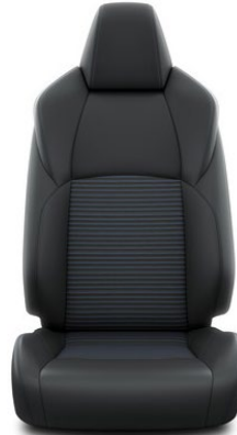
Sitzbezug Teilleder schwarz