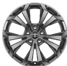
18" Leichtmetallfelge 5 Doppelspeichen silber