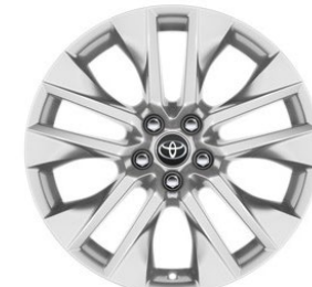
19" Leichtmetallfelge 5 Doppelspeichen silber