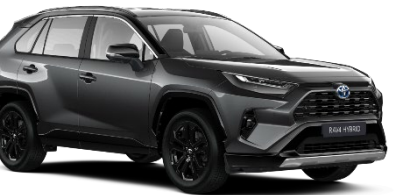
2QZ Ash Grey Metallic/Black