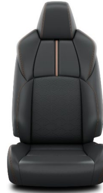
Sitzbezug Teilleder schwarz Ziernähte orange