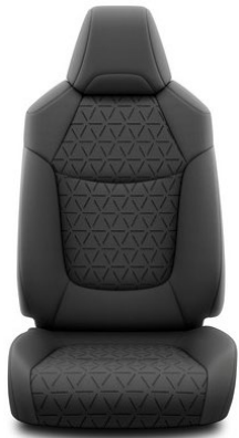
Sitzbezug Stoff schwarz