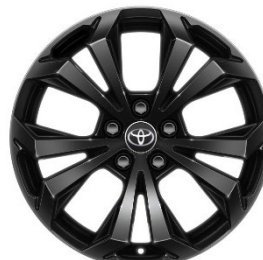
19" Leichtmetallfelge 5 Doppelspeichen schwarz