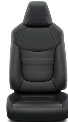
Sitzbezug Leder 1) schwarz (20)