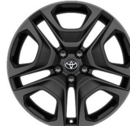
19" Leichtmetallfelgen 5 Doppelspeichen schwarz matt