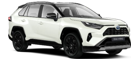
2QJ Pearl White Metallic/Black

Erfahrungsgemäß können Druckfarben den Farbton von Lackierungen nicht originalgetreu wiedergeben