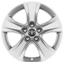
17" Leichtmetallfelge 5 Speichen silber