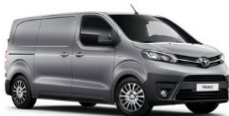
KCA Silver Shadow