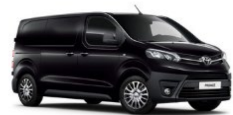
KTV Graphite Black

● = Serie. Die Preise sind unverbindliche Preisempfehlungen des Herstellers ab Werk in Euro exkl. MwSt. Erfahrungsgemäß können Druckfarben den Farbton von Lackierungen nicht originalgetreu wiedergeben.