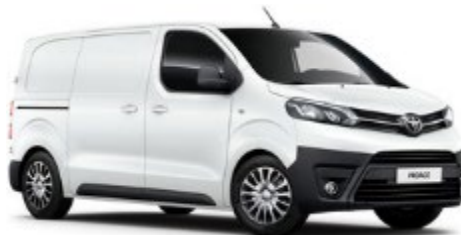
EPR Ice White