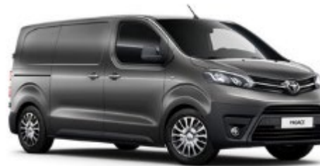
EVL Falcon Grey