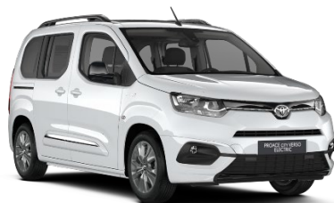
EPR Ice White