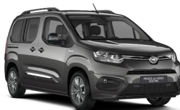
EVL Falcon Grey