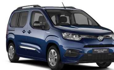
EJG Night Blue

Die Preise sind unverbindliche Preisempfehlungen des Herstellers ab Werk in Euro exkl. NoVA und MwSt.