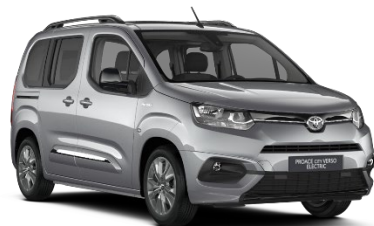
KCA Silver Shadow