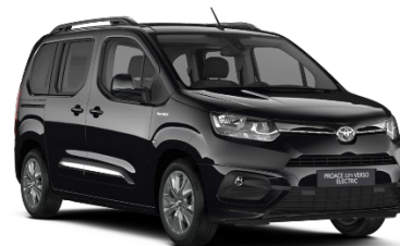
KTV Graphite Black