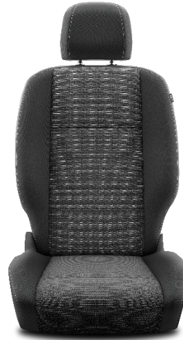
Sitzbezug Stoff Manhattan