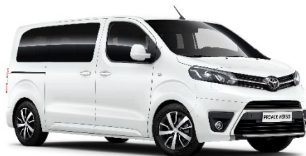
EPR Ice White