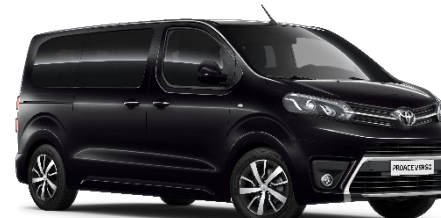
KTV Graphite Black