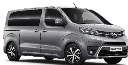
KCA Silver Shadow