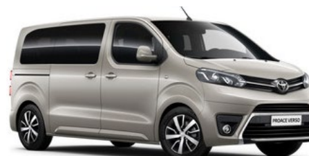
NEU Sable Silver Beige