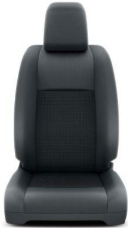
Sitzbezug Stoff Dunkelgrau