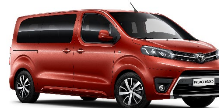
KHK Ember Orange