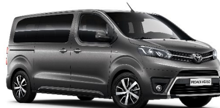
EVL Falcon Grey