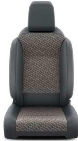
Sitzbezug Stoff Braun