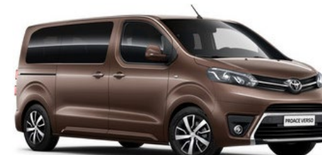
KCM Rich Oak Brown