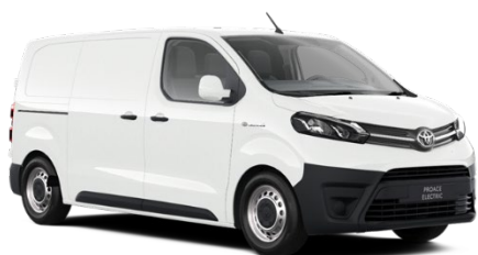
EPR Ice White