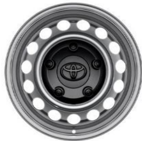
16" Stahlfelgen inkl. Radnabenabdeckung