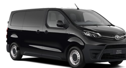
KTV Graphite Black