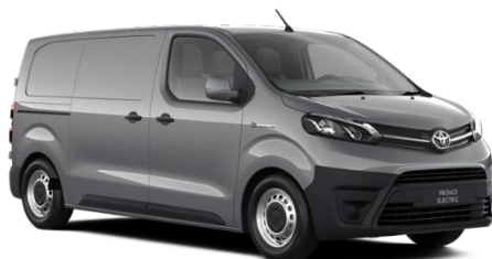
KCA Silver Shadow