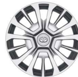
16" Stahlfelgen inkl. Radkappen