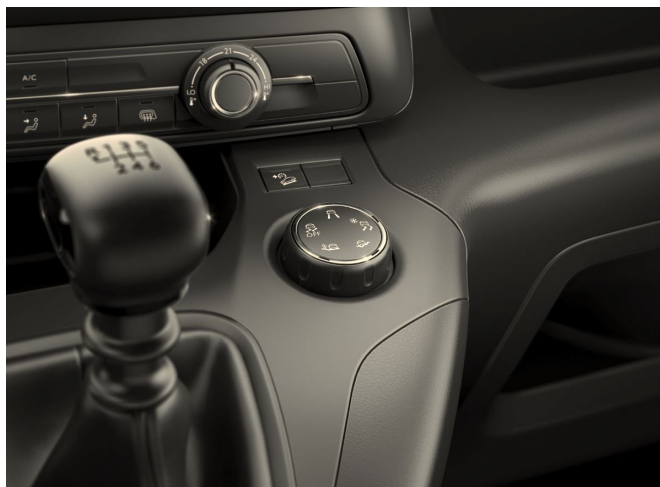
Toyota Traction Select (optional verfügbar)