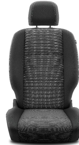
Sitzbezug Stoff Manhattan