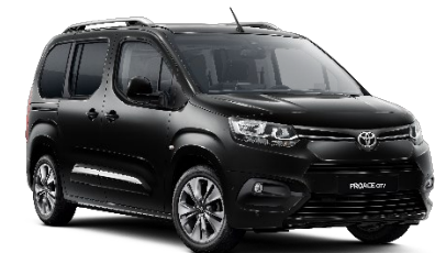
KTV Graphite Black

Die Preise sind unverbindliche Preisempfehlungen des Herstellers ab Werk in Euro exkl. NoVA und MwSt.