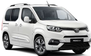
EWP Vivid White