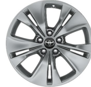
17" Leichtmetallfelge 5 Doppelspeichen silber