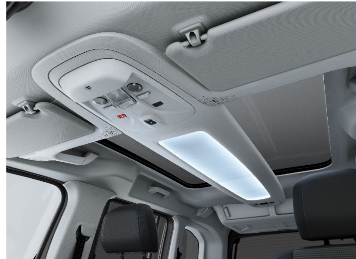
Panoramadach mit Multifunktionsdach (Family+)