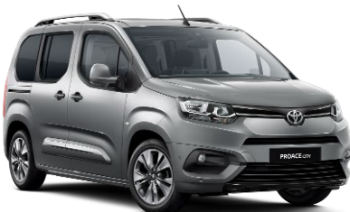
KCA Silver Shadow