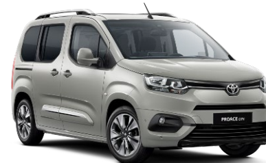
EEU Silver Beige