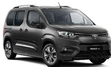
EVL Falcon Grey