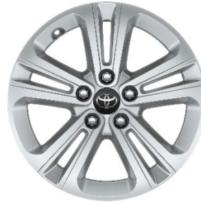
16" Leichtmetallfelge 5 Doppelspeichen silber