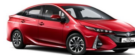
3U5 Emotional Red Metallic