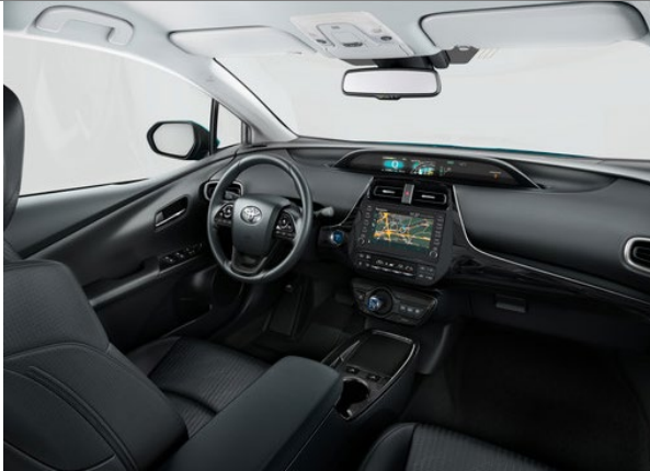
Interieur schwarz & Sitzbezug Stoff schwarz (Code 20)