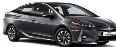
1G3 Ash Grey Metallic