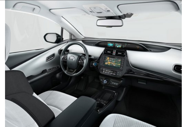
Interieur rauchgrau & Sitzbezug Stoff rauchgrau (Code 20)