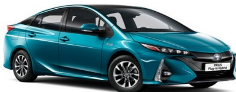
791 Aqua Metallic