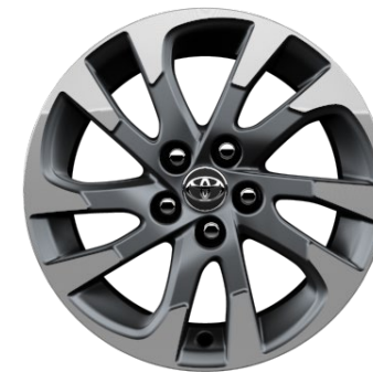
15" Bi-Tone Grau/Silber Leichtmetallfelgen 5 Doppelspeichen

Erfahrungsgemäß können Druckfarben den Farbton von Lackierungen nicht originalgetreu wiedergeben