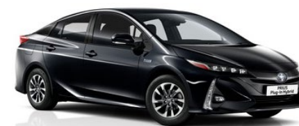
218 Attitude Black Metallic

Erfahrungsgemäß können Druckfarben den Farbton von Lackierungen nicht originalgetreu wiedergeben