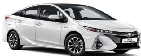
040 Pure White