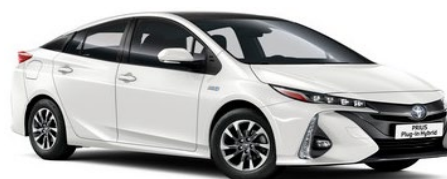
089 Platinum Pearlwhite Metallic