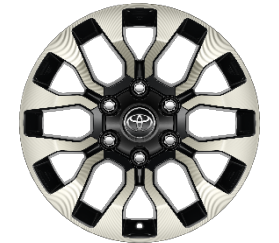
17" Leichtmetallfelgen 6 Doppelspeichen schwarz/oberflächenpoliert