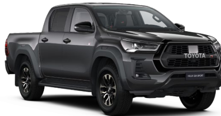
1G3 Ash Grey Metallic