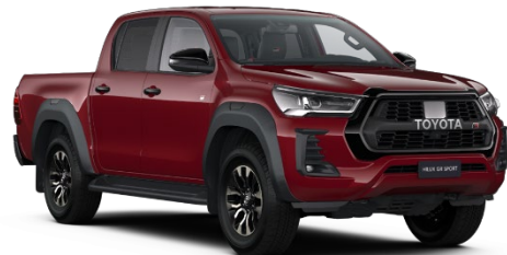
3T6 Crimson Spark Red Metallic