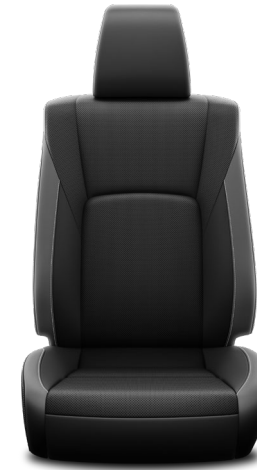
Sitzbezug Leder perforiert 1) Schwarz/grau