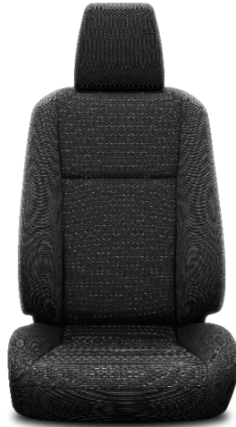
Sitzbezug Stoff schwarz