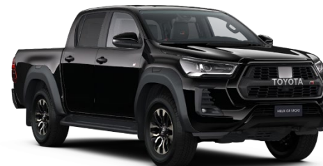
218 Attitude Black Metallic