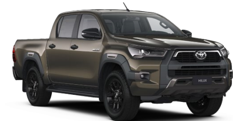
6X1 Oxide Bronze Metallic