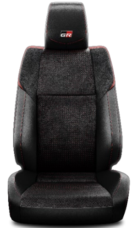
Sitzbezug Suede ® perforiert 2) mit Leder-Applikation und roten Highlights schwarz