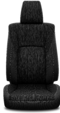
Sitzbezug Stoff schwarz