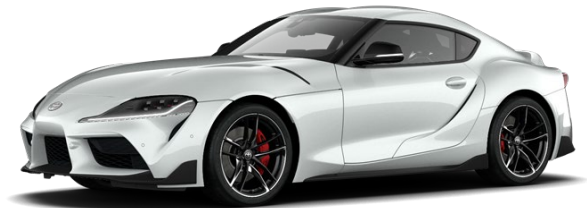
D02 Quick Silver