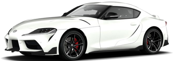
D01 Subzero White