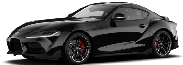
D04 Midnight Black

Erfahrungsgemäß können Druckfarben den Farbton von Lackierungen nicht originalgetreu wiedergeben.