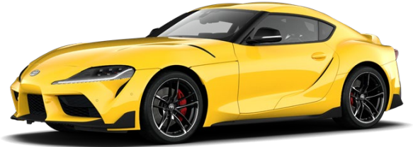
D06 Lightning Yellow