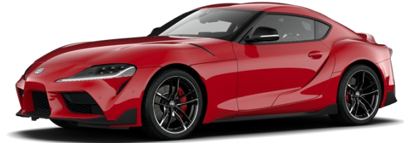
D05 Prominence Red