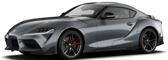
D03 Ice Grey