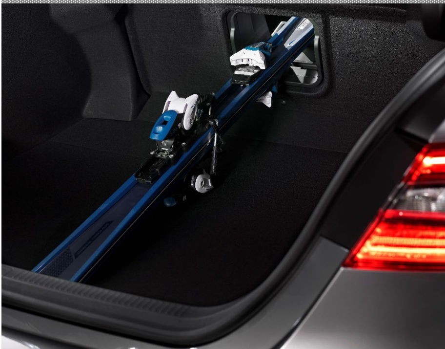
TOYOTA CAMRY STAND JULI 2022