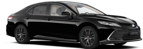
218 Attitude Black Metallic