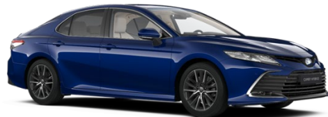
8W7 Cobalt Blue Metallic