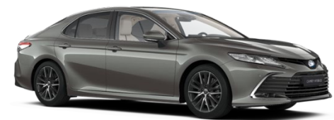
1L5 Precious Metal Metallic

Erfahrungsgemäß können Druckfarben den Farbton von Lackierungen nicht originalgetreu wiedergeben