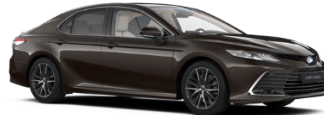
4X7 Graphite Brown Metallic