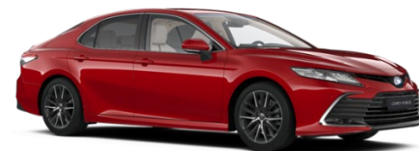
3U9 Emotional Red Metallic (Symbolfoto)