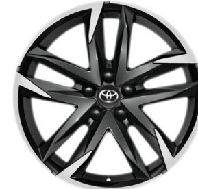
19" Leichtmetallfelge 5 Doppelspeichen schwarz/silber