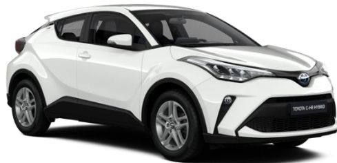
040 Pure White