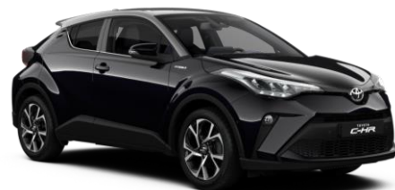
2TA Night Sky Black Metallic / Silver