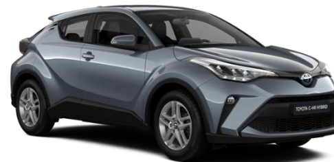
1K3 Celestite Grey Metallic