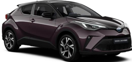
2XE Deep Amethyst Metallic / Black