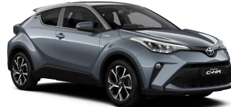
2TJ Celestite Grey Metallic / Silver