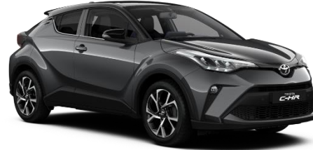
2NB Ash Grey Metallic / Black