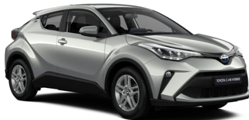
1L0 Shimmering Silver Metallic