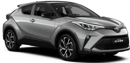
2VU Shimmering Silver Metallic / Black