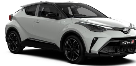
2VF Dynamic Grey Metallic / Black