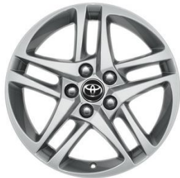
17" Leichtmetallfelge 5 Doppelspeichen silber