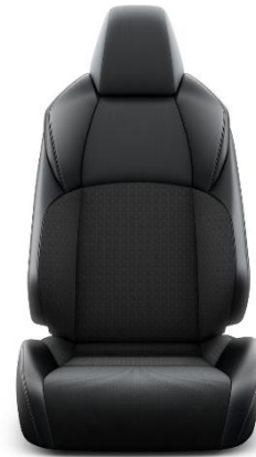
Sitzbezug Stoff mit Textilleder-Applikationen schwarz