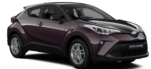
9AH Deep Amethyst