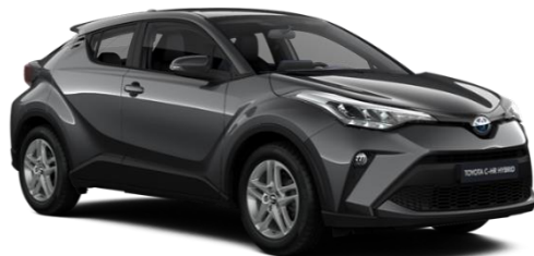
1G3 Ash Grey Metallic