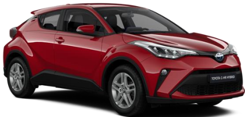
3U5 Emotional Red Metallic