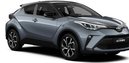
2TH Celestite Grey Metallic / Black