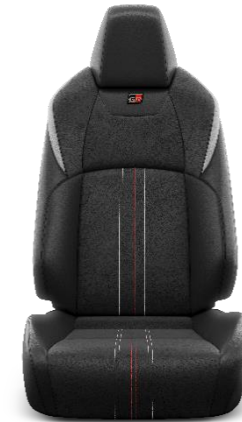
Sitzbezug Alcantara®/Leder 1) schwarz Ziernähte rot & weiß