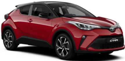
2TB Emotional Red Metallic / Black