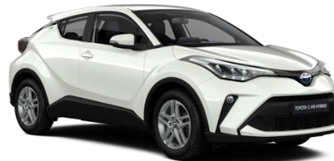
089 Platinum Pearlwhite Metallic

Erfahrungsgemäß können Druckfarben den Farbton von Lackierungen nicht originalgetreu wiedergeben