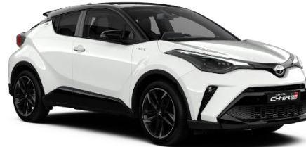
2MQ Pure White / Black