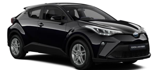
209 Night Sky Black Metallic