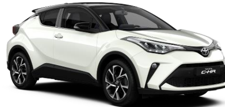
2VP Platinum Pearlwhite Metallic / Black