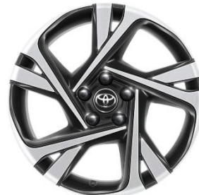
18" Leichtmetallfelge 5 Doppelspeichen schwarz/silber