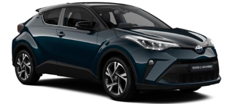
2YB Midnight Teal Metallic / Black