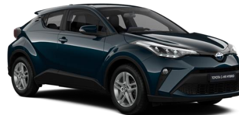
785 Midnight Teal Metallic