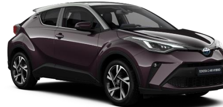
2XF Deep Amethyst Metallic / Silver

Erfahrungsgemäß können Druckfarben den Farbton von Lackierungen nicht originalgetreu wiedergeben