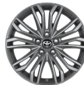
18" Leichtmetallfelge 10 Doppelspeichen anthrazit