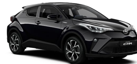
209 Night Sky Black Metallic