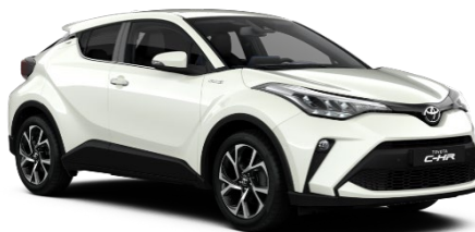
089 Platinum Pearlwhite Metallic

Erfahrungsgemäß können Druckfarben den Farbton von Lackierungen nicht originalgetreu wiedergeben