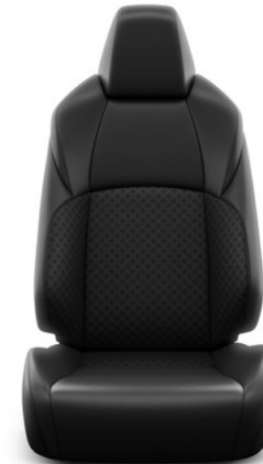
Sitzbezug Leder 2) schwarz (optional)