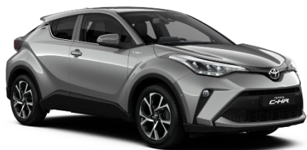
1L0 Shimmering Silver Metallic