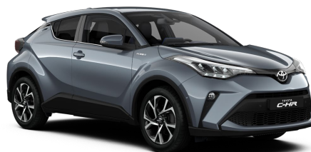
1K3 Celestite Grey Metallic