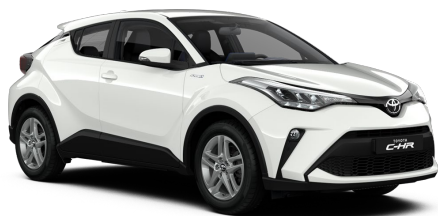
040 Pure White