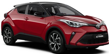
2TB Emotional Red Metallic / Black