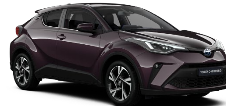
9AH Deep Amethyst