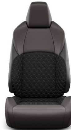
Sitzbezug Teilleder braun/schwarz Steppmuster in Rautenform