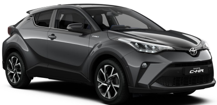
1G3 Ash Grey Metallic