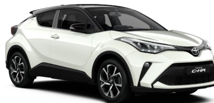
2VP Platinum Pearlwhite Metallic / Black