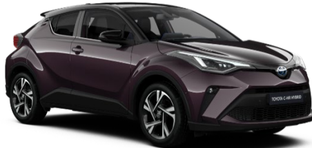
2XE Deep Amethyst Metallic / Black