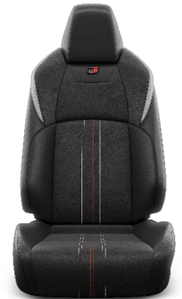
Sitzbezug Alcantara®/Leder 1) schwarz Ziernähte rot & weiß