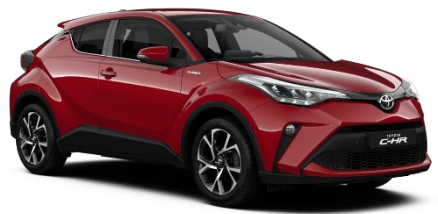
3U5 Emotional Red Metallic