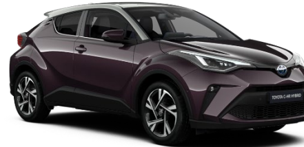
2XF Deep Amethyst Metallic / Silver

Erfahrungsgemäß können Druckfarben den Farbton von Lackierungen nicht originalgetreu wiedergeben