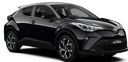
2TA Night Sky Black Metallic / Silver