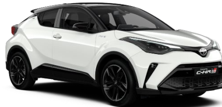
2MQ Pure White / Black