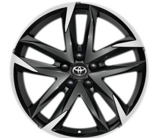
19" Leichtmetallfelge 5 Doppelspeichen schwarz/silber