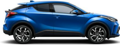
8X2 Nebulablau Metallic