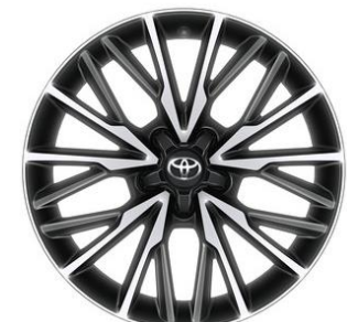
18" Leichtmetallfelge 10 Doppelspeichen Schwarz/silber