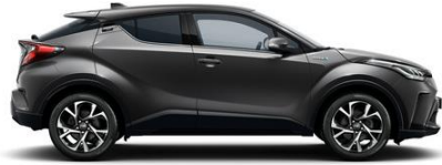
1G3 Anthrazit Metallic