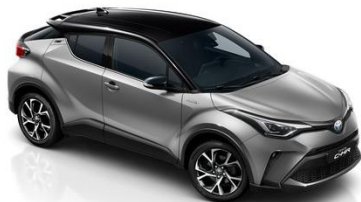
2NK Metalstream/Schwarz Metallic