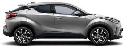
1K0 Metalstream Metallic