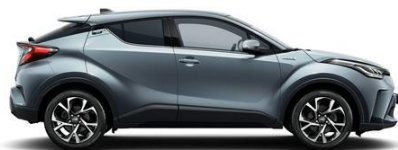
1K3 Celestitgrau Metallic