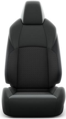
Sitzbezug Stoff schwarz