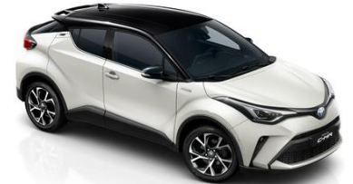
2NA Perlmutterweiß/Schwarz Metallic