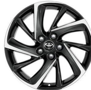
18" Leichtmetallfelge 10 Speichen schwarz/silber