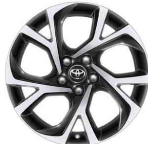
18" Leichtmetallfelge 5 Doppelspeichen schwarz/silber