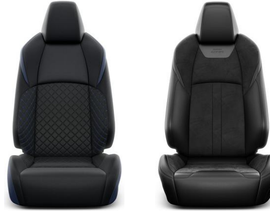
Sitzbezug Stoff schwarz/blau Ziernähte in blau