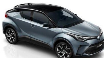
2TH Celestitgrau/Schwarz Metallic