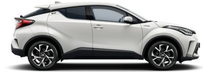
070 Perlmutterweiß Metallic