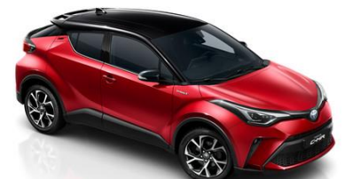
2TB Royalrot/Schwarz Metallic