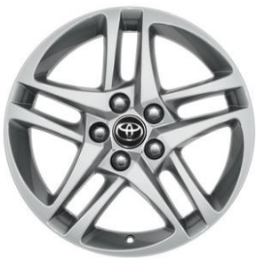
17" Leichtmetallfelge 5 Doppelspeichen silber