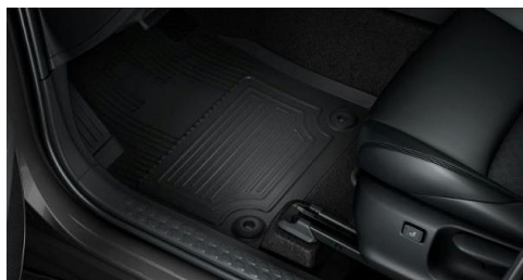
Gummimatten-Set (vorne & hinten)