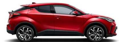
3U5 Royalrot Metallic