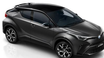
2NB Anthrazit/Schwarz Metallic