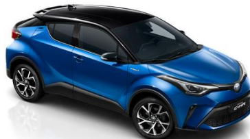
2NH Nebulablau/Schwarz Metallic