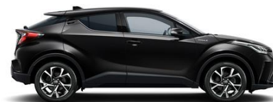
209 Onyxschwarz Metallic