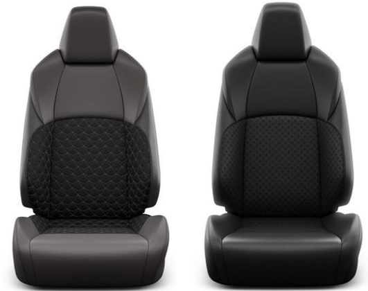
Sitzbezug Teilleder braun/schwarz Steppmuster in Rautenform