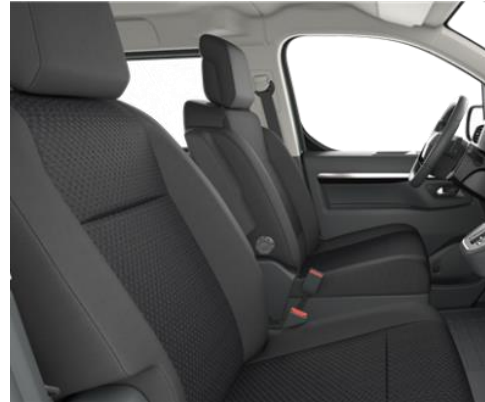
Sitzbezug Stoff Family