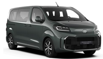
EDU All Terrain Green

● = Serie. Die Preise sind unverbindliche Preisempfehlungen des Herstellers ab Werk in Euro exkl. MwSt.