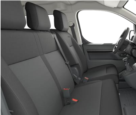
Sitzbezug Stoff Dunkelgrau