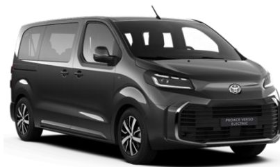
KKJ Titanium Grey