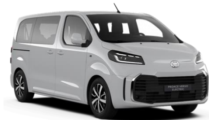
EPR Ice White