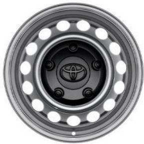
16" Stahlfelgen mit Radnabenabdeckung