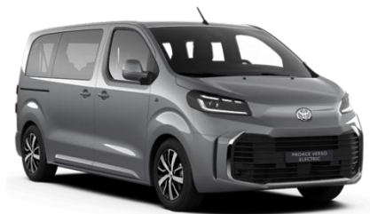
KCA Silver Shadow