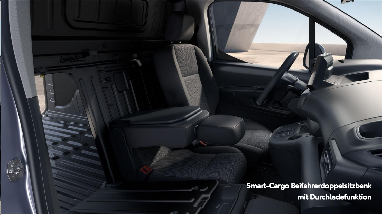
Smart-Cargo Beifahrerdoppelsitzbank mit Durchladefunktion