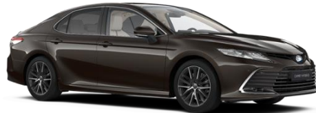
4X7 Graphite Brown Metallic