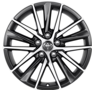
18" Leichtmetallfelge 5-Triple-Speichen