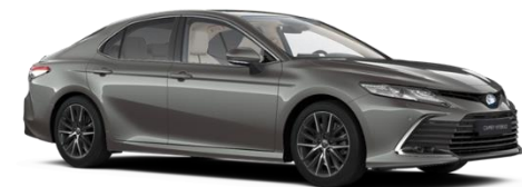
1L5 Precious Metal Metallic

Erfahrungsgemäß können Druckfarben den Farbton von Lackierungen nicht originalgetreu wiedergeben