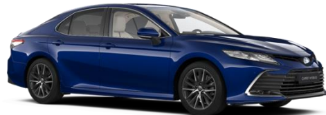
8W7 Cobalt Blue Metallic