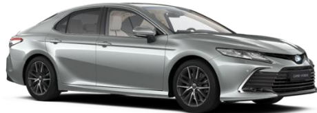
1F7 Ultra Silver Metallic