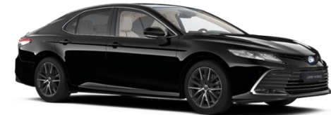
218 Attitude Black Metallic