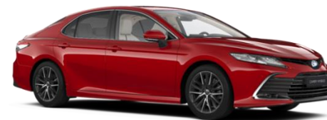
3U9 Emotional Red Metallic (Symbolfoto)