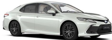
089 Platinum Pearlwhite Metallic