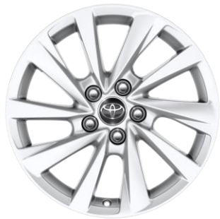
17" Leichtmetallfelge 5-Doppelspeichen