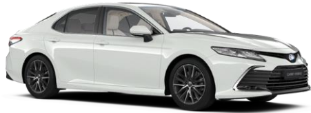
040 Pure White