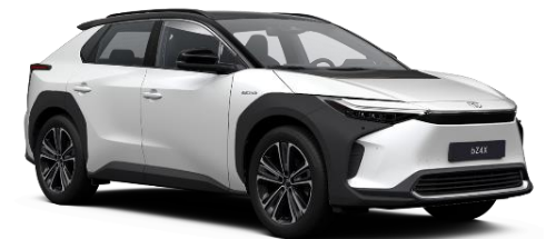
2VP Platinum Pearlwhite/Black Metallic