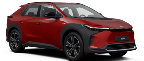
3U5 Emotional Red Metallic