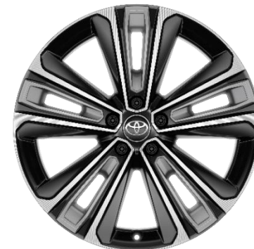
20" Leichtmetallfelgen 5 Doppel-Speichen schwarz / oberflächenpoliert

● = Serie, ○ = Option, P = Teil eines Pakets, -- = nicht verfügbar. Die Preise sind unverbindliche Preisempfehlungen des Herstellers ab Werk in Euro exkl. NoVA und MwSt.