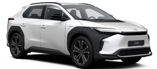
089 Platinum Pearlwhite Metallic