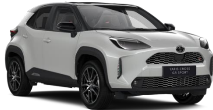
2VF Dynamic Grey Metallic / Black