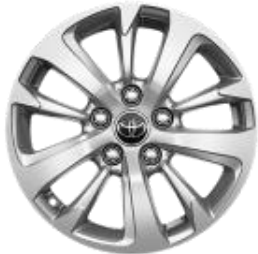
16" Leichtmetallfelge 10 Speichen silber