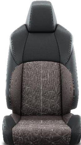
Sitzbezug Stoff mit Textilleder-Applikationen 1 taupe