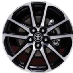
18" Leichtmetallfelge 5 Doppelspeichen schwarz/silber