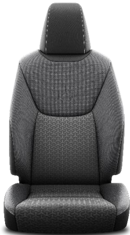
Sitzbezug Stoff schwarz