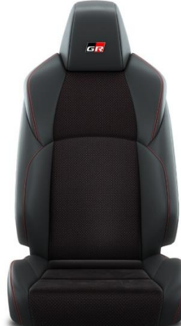
Sitzbezug Ultrasuede™ mit Textilleder-Applikationen schwarz und roten Ziernähten