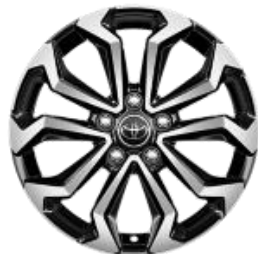
17" Leichtmetallfelge 5 Doppelspeichen schwarz/silber