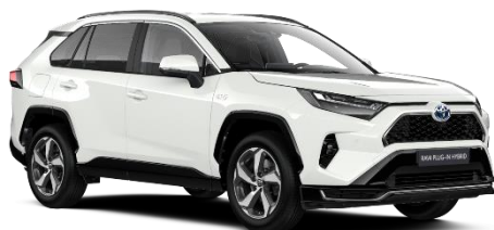
040 Pure White