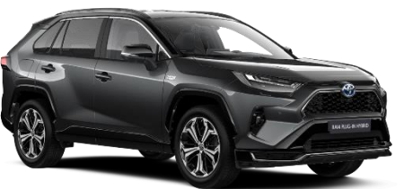
2QZ Ash Grey/Black Metallic