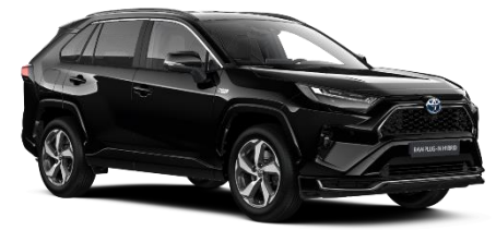
218 Attitude Black Metallic