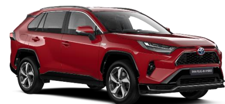
3U5 Emotional Red Metallic