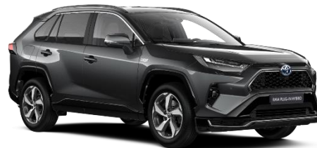
1G3 Ash Grey Metallic