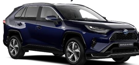
8X8 Midnight Blue Metallic