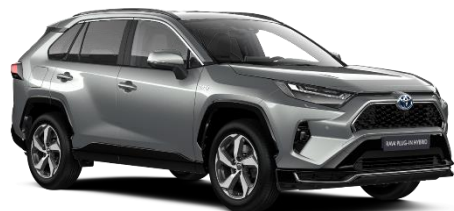
1D6 Zircon Silver Metallic