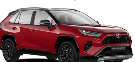
2PS Emotional Red/Black Metallic

Erfahrungsgemäß können Druckfarben den Farbton von Lackierungen nicht originalgetreu wiedergeben