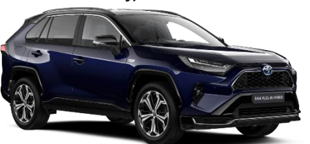
2RA Midnight Blue/Black Metallic