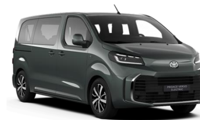
EDU All Terrain Green

● = Serie. Die Preise sind unverbindliche Preisempfehlungen des Herstellers ab Werk in Euro exkl. MwSt.