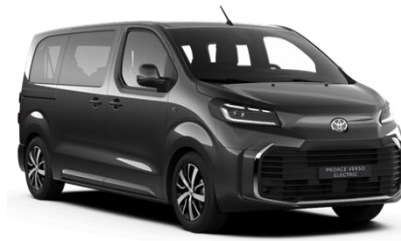
KTV Graphite Black