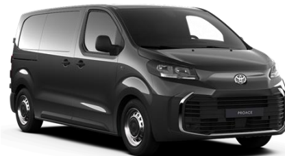
KKJ Titanium Grey