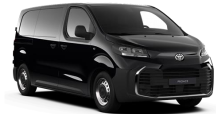
KTV Graphite Black

● = Serie. Die Preise sind unverbindliche Preisempfehlungen des Herstellers ab Werk in Euro exkl. MwSt. Erfahrungsgemäß können Druckfarben den Farbton von Lackierungen nicht originalgetreu wiedergeben.