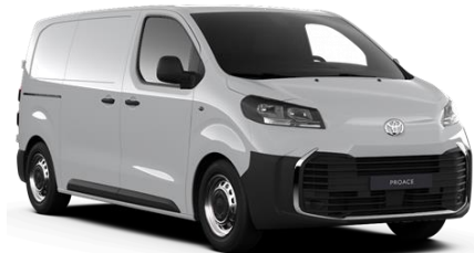
EPR Ice White