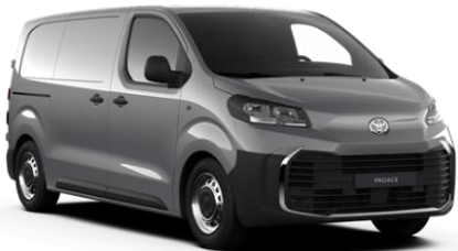
KCA Silver Shadow