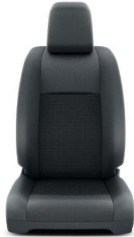
Sitzbezug Stoff Dunkelgrau

KASTENWAGEN / DOPPELKABINE / FAHRGESTELL