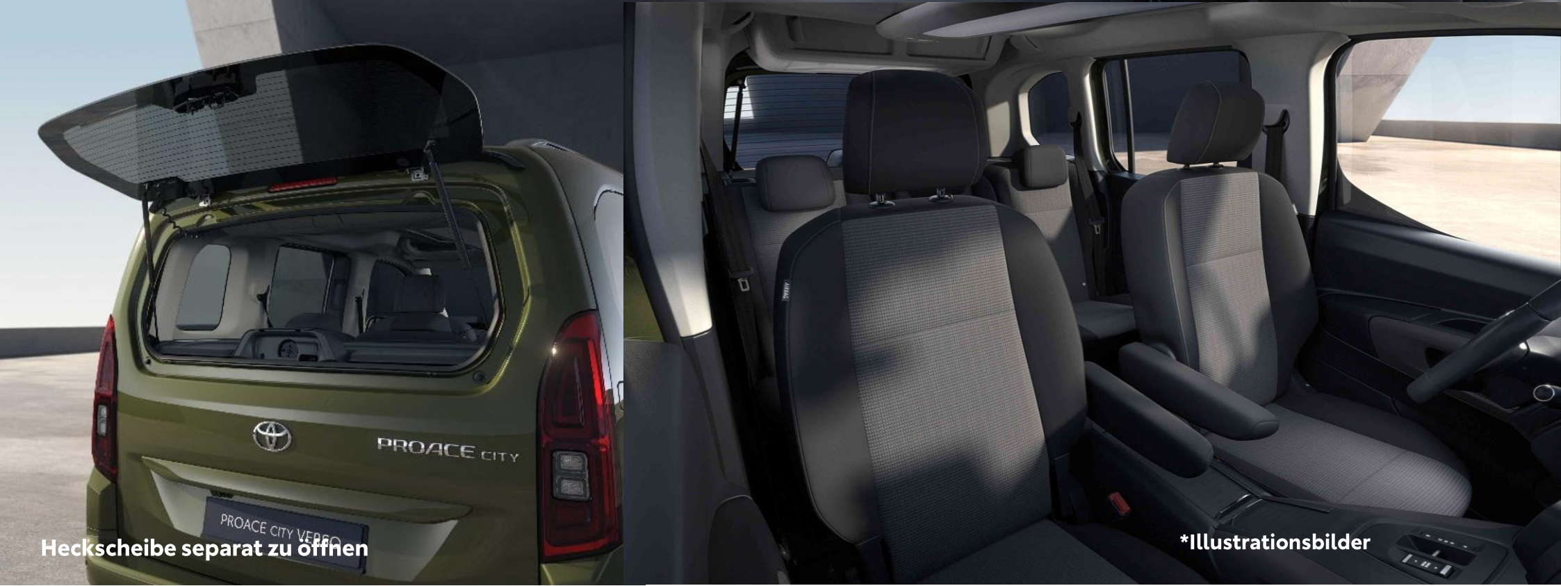
Heckscheibe separat zu öffnen