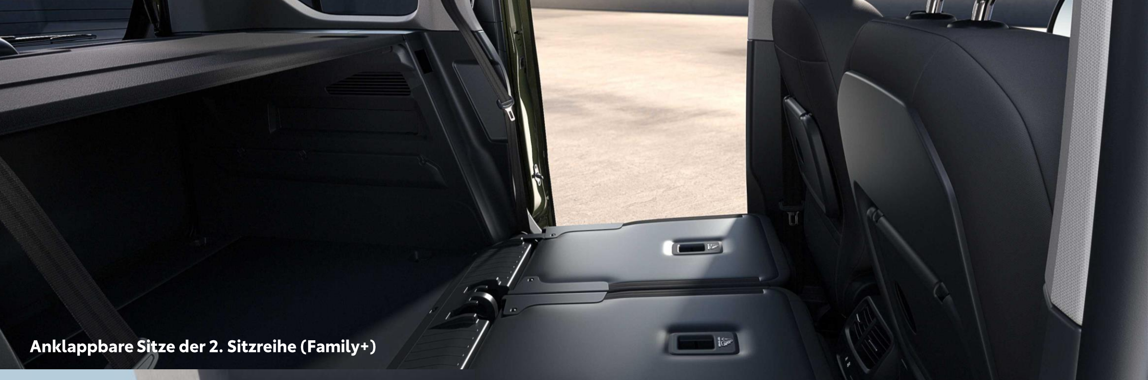
Anklappbare Sitze der 2. Sitzreihe (Family+)