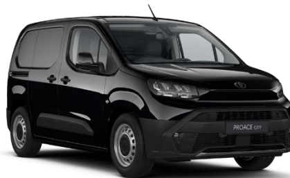
KTV Graphite Black

● = Serie. Die Preise sind unverbindliche Preisempfehlungen des Herstellers ab Werk in Euro exkl. MwSt. Erfahrungsgemäß können Druckfarben den Farbton von Lackierungen nicht originalgetreu wiedergeben.