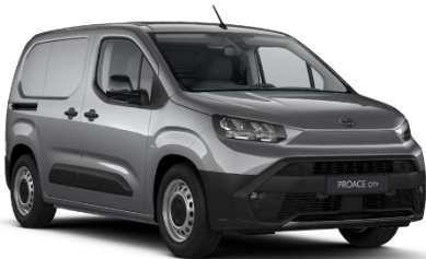
KCA Silver Shadow