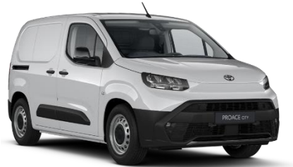
EPR Ice White