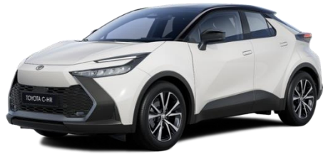
040/2MQ – Pure White / Onyx Black