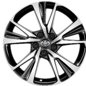
18" Leichtmetallfelge 5 Doppelspeichen schwarz/oberflächenpoliert