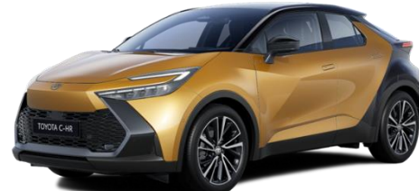
2YT – Sulfur Gold / Onyx Black

Erfahrungsgemäß können Druckfarben den Farbton von Lackierungen nicht originalgetreu wiedergeben.