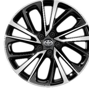
19" Leichtmetallfelge 5 Doppelspeichen schwarz/oberflächenpoliert