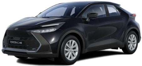
209 – Night Sky Black (nur Monotone)