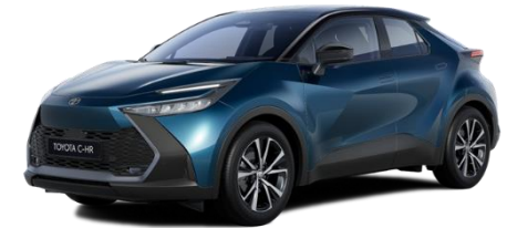
785/2YB – Midnight Teal / Onyx Black