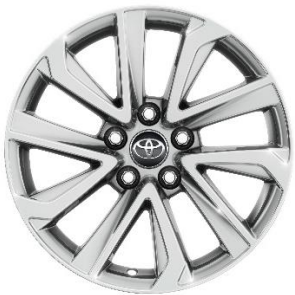
17" Leichtmetallfelge 5 Doppelspeichen silber