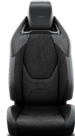
Sitzbezug Ultrasuede™/veganes Leder Mit roten Ziernähten