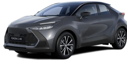
1G3/2NB – Ash Grey / Onyx Black