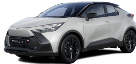
2VF – Dynamic Grey / Onyx Black