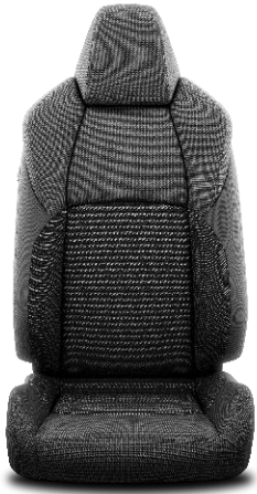
Sitzbezug Stoff schwarz