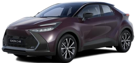
9AH/2XE – Deep Amethyst / Onyx Black