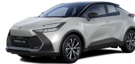
1L0/2VU – Shimmering Silver / Onyx Black