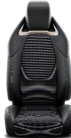
Sitzbezug Stoff mit veganem Leder und Ultrasuede™ Applikationen