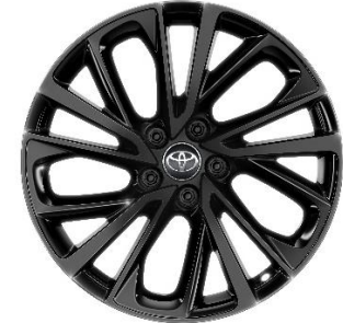
19" Leichtmetallfelge 5 Doppelspeichen schwarz