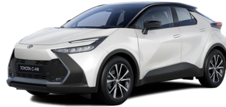
089/2VP – Platinum Pearlwhite / Onyx Black