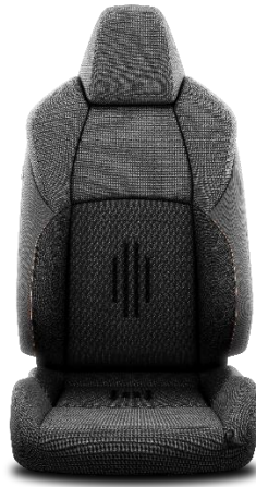
Sitzbezug Stoff schwarz