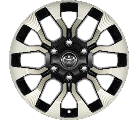
17" Leichtmetallfelgen 6 Doppelspeichen schwarz/oberflächenpoliert