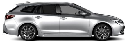
1L0 Shimmering Silver Metallic