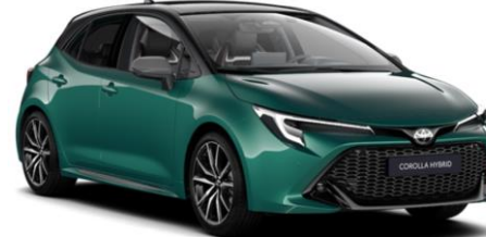
M28 Super Green / Night Sky Black