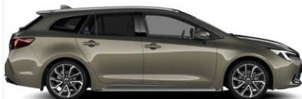
6X1 Oxide Bronze Metallic