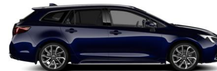
8X8 Midnight Blue Metallic