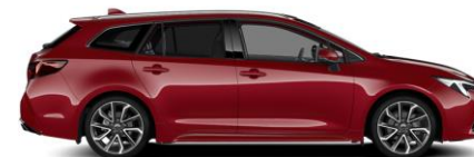
3U5 Emotional Red Metallic