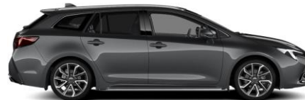
1G3 Ash Grey Metallic