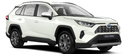
089 Platinum Pearlwhite Metallic