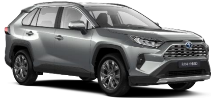
1D6 Zircon Silver Metallic