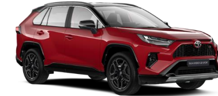
2SU Emotional Red / Black