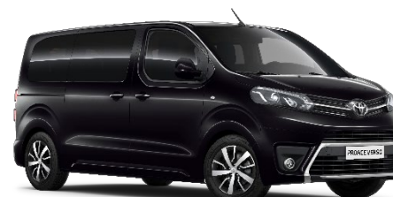
KTV Graphite Black