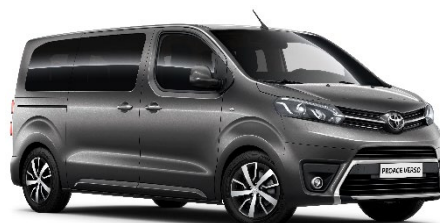
EVL Falcon Grey