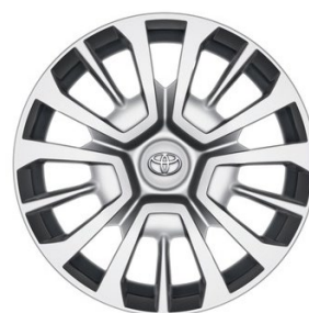
17" Stahlfelgen mit Radzierkappen