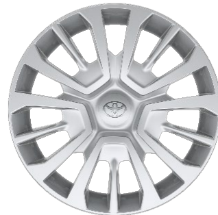
16" Stahlfelgen mit Radzierkappen silber