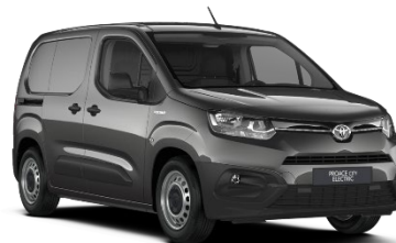
EVL Falcon Grey