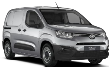
KCA Silver Shadow