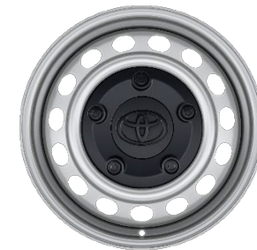
16" Stahlfelgen inkl. Radnabenabdeckung