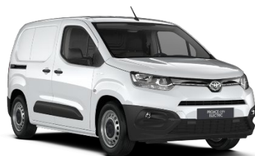
EPR Ice White