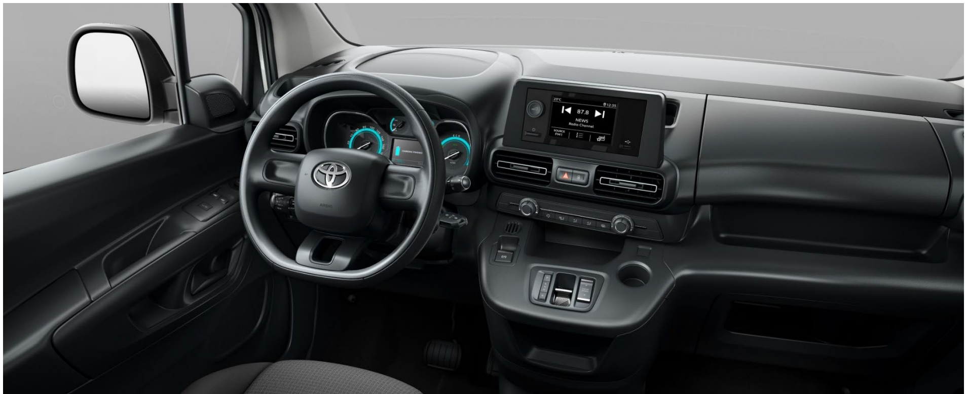
Interieur (Ausstattungsversion Comfort)