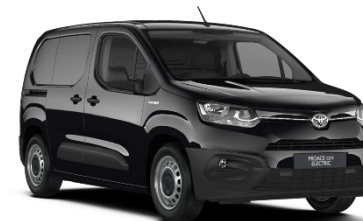
KTV Graphite Black