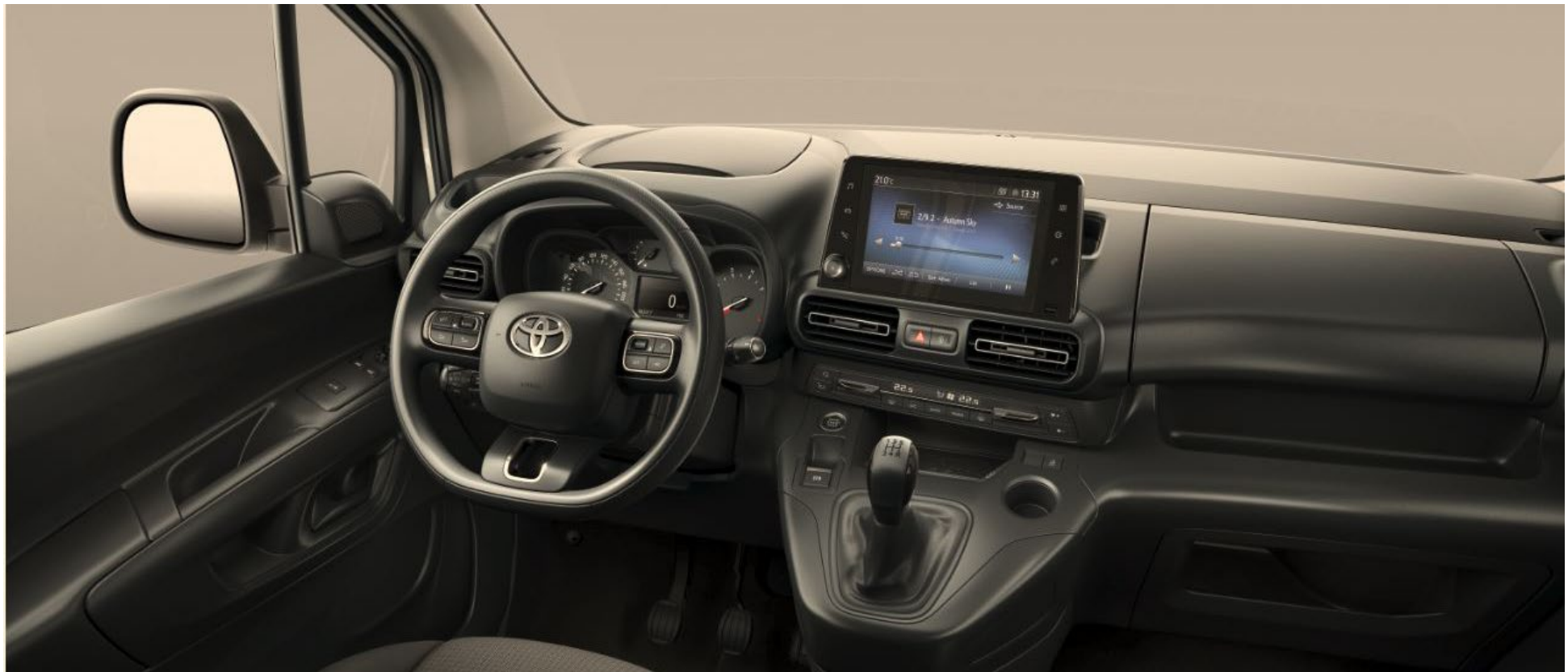
Interieur (Comfort mit Navigations-Paket)