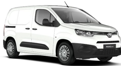
EPR Ice White