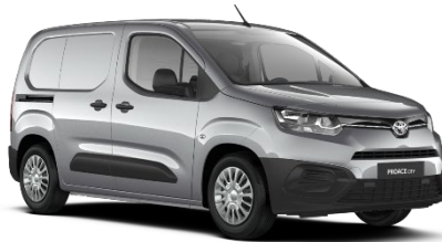
KCA Silver Shadow