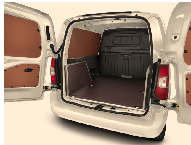
Laderaumverkleidung, Holz (über Zubehör verfügbar)