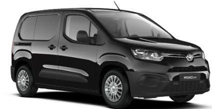
KTV Graphite Black

Die Preise sind unverbindliche Preisempfehlungen des Herstellers ab Werk in Euro exkl. MwSt.