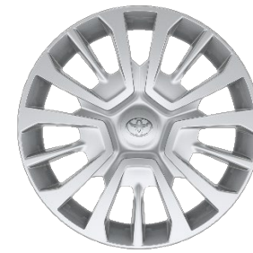
16" Stahlfelgen mit Radzierkappen silber