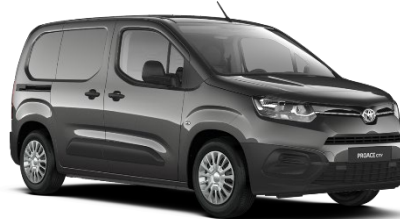
EVL Falcon Grey