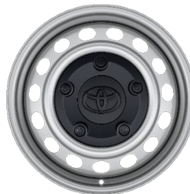
16" Stahlfelgen inkl. Radnabenabdeckung