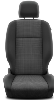
Sitzbezug Stoff grau