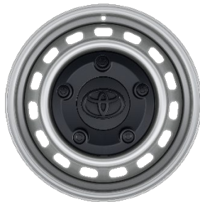
15" Stahlfelgen inkl. Radnabenabdeckung