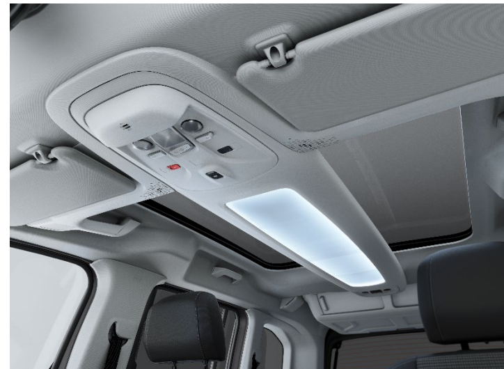
Panoramadach mit Multifunktionsdach (Family+)