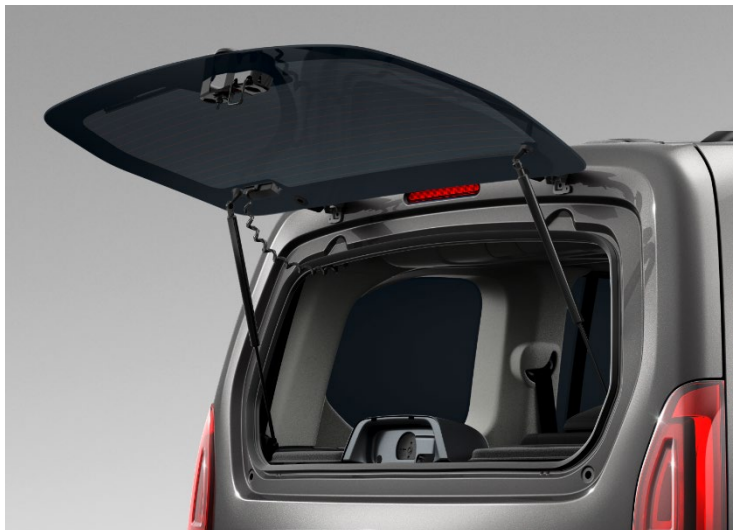
Heckscheibe separat zu öffnen (ausstattungsabhängig)