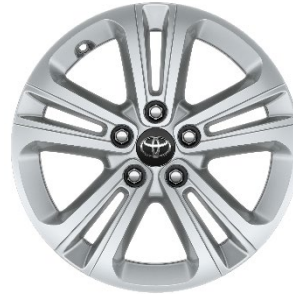
16" Leichtmetallfelge 5 Doppelspeichen silber