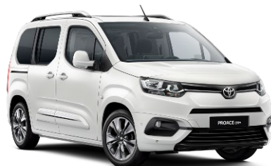
EPR Ice White