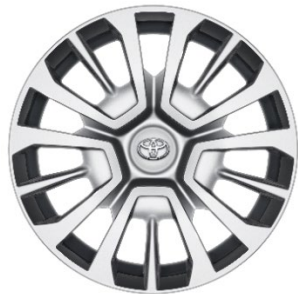
16" Stahlfelgen mit Radzierkappen schwarz