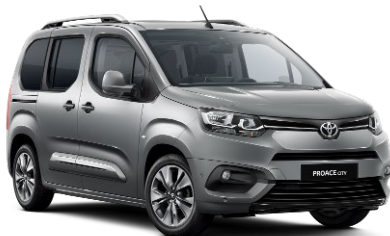
KCA Silver Shadow