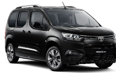
KTV Graphite Black

Die Preise sind unverbindliche Preisempfehlungen des Herstellers ab Werk in Euro exkl. NoVA und MwSt.