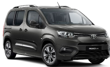
EVL Falcon Grey