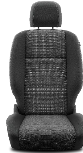
Sitzbezug Stoff Manhattan