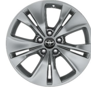
17" Leichtmetallfelge 5 Doppelspeichen silber