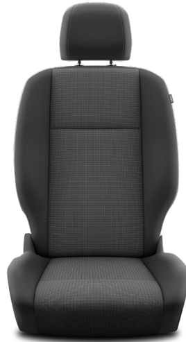
Sitzbezug Stoff grau