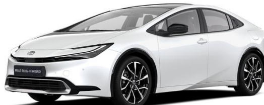
089 – Platinum Pearlwhite Metallic