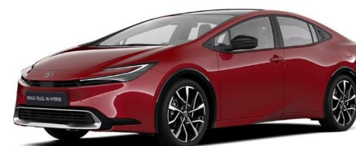
3U5 – Emotional Red Metallic

Die Preise sind unverbindliche Preisempfehlungen des Herstellers ab Werk in Euro exkl. NoVA und MwSt. Erfahrungsgemäß können Druckfarben den Farbton von Lackierungen nicht originalgetreu wiedergeben.