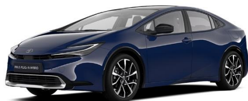
8Q4 – Indigo Blue