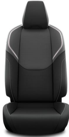
Sitzbezug Stoff, schwarz