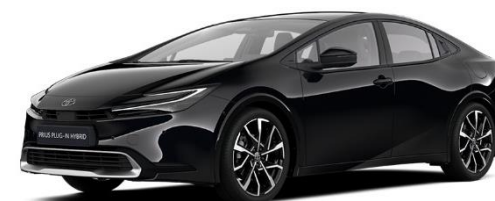
218 – Attitude Black Metallic