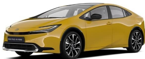
5C5 – Mustard Metallic