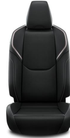
Sitzbezug Ledernachbildung, schwarz