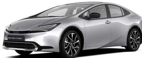
1L0 – Shimmering Silver Metallic