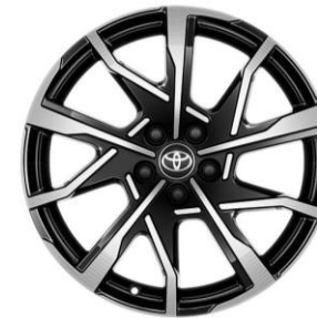
19" Leichtmetallfelgen in Schwarz, poliert (195/50R19)