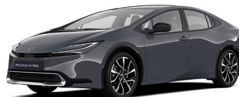
1M2 – Ash Metallic