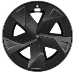
17" Leichtmetallfelgen mit Aerodynamik-Radabdeckungen in Dunkelgrau (195/60R17)