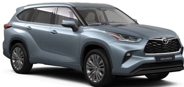
1K5 Moondust Metallic