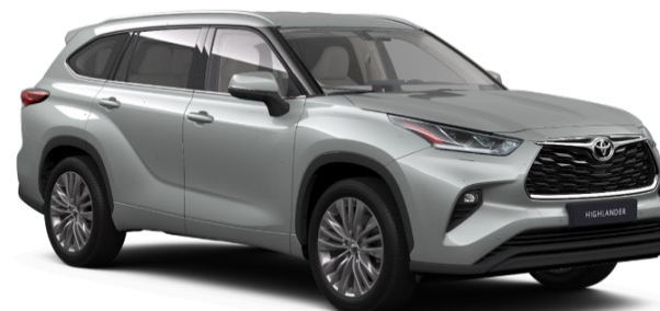
1J9 Celestial Silver Metallic