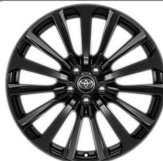
20" Leichtmetallfelge 15 Speichen schwarz