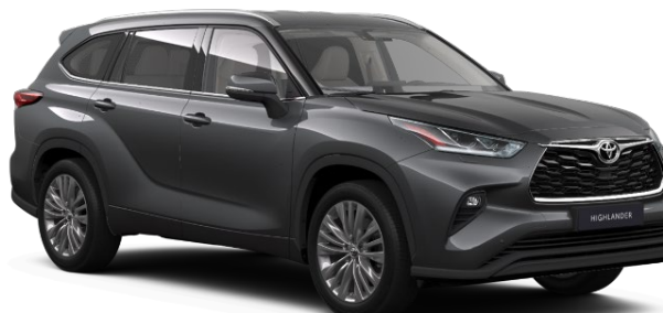
1G3 Ash Grey Metallic