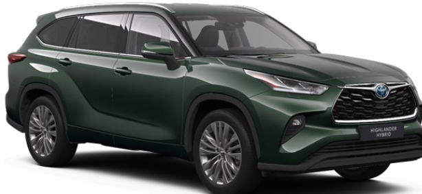
6X5 Cypress Green Metallic