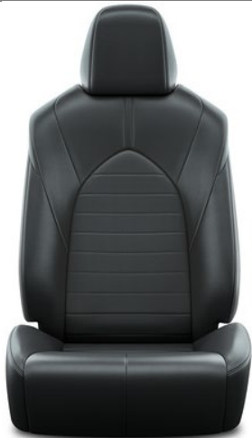
Textilleder, schwarz (EB20)