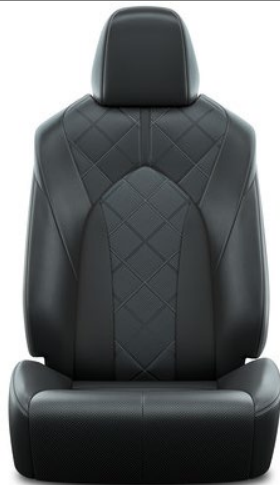
Premium-Leder 1 , schwarz, perforiert (LA20)