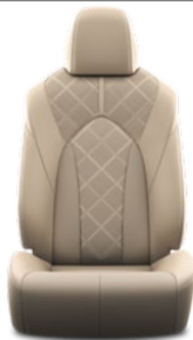
Premium-Leder 1 , beige, perforiert (LA40)