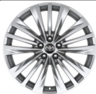
20" Leichtmetallfelge 5 Trippelspeichen silber