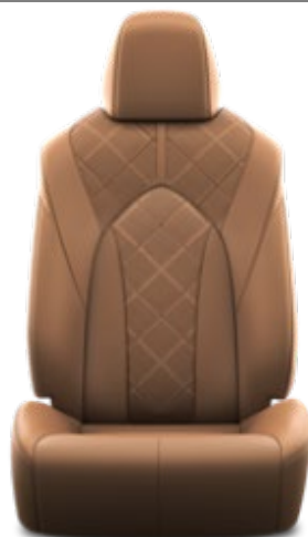
Premium-Leder 1 , cognac, perforiert (LA41)