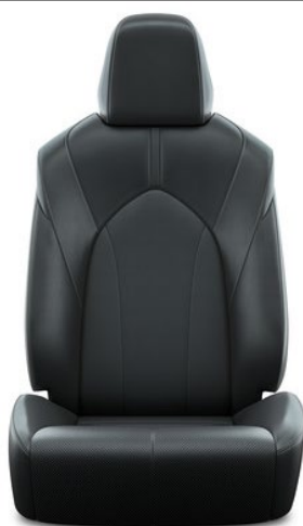
Leder 1 , schwarz, perforiert (LB20)