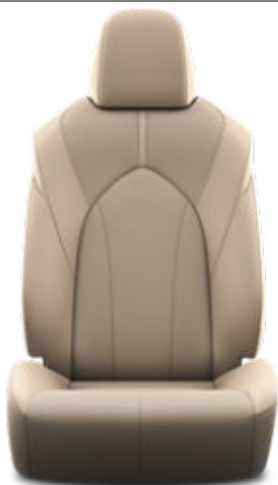
Leder 1 , beige, perforiert (LB40)