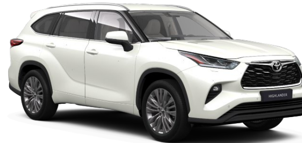
089 Platinum Pearlwhite Metallic

Erfahrungsgemäß können Druckfarben den Farbton von Lackierungen nicht originalgetreu wiedergeben