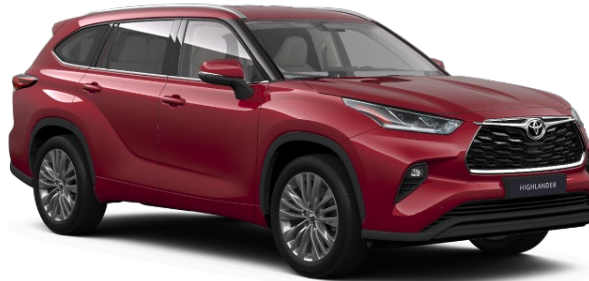
3T3 Tokyo Red Metallic