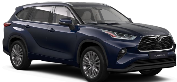
8X8 Midnight Blue Metallic