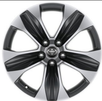
18" Leichtmetallfelge 5 Speichen Anthrazit / oberflächenpoliert