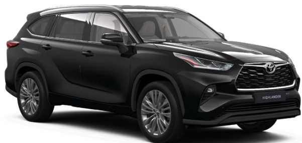
218 Attitude Black Metallic